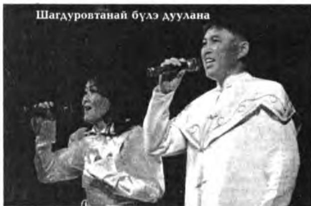
Шагдуровтанай бүлэ дуулана