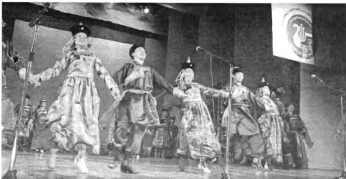
«Алтарганын» конкурсын дүнгүүд