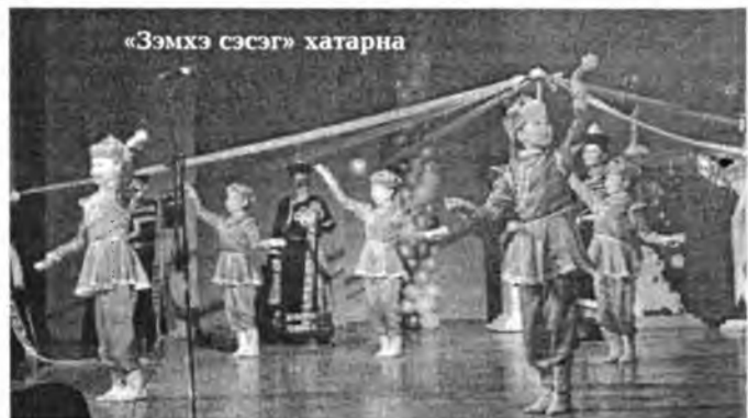
«Зэмхэ сэсэг» хатарна