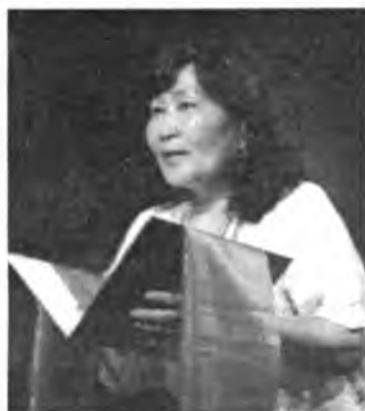
зохёолшо түрэл хэлэнэйнгэе баялыгы хэрэглэжэ, түүхэдэ өөрынгөө нэрээ бээүүлһэн хүн тухай эдир наһатай уншагшадта ойлгосотойгоор бээхые оролодо.

Ороло үгэһөө, зургаан хубиһаа бүридэһэн энэ зохёол бүхыдөө 1300 мурһөө бүридэһэн. Мүрнүүдыень тоолохоодо, ехэшье, багашье зохёол гэжэ һанагдана. Зохёолойноо ороло үгэдэ уран зохёолшо урдаа табинан зорилогшоо нимэ мүрнүүдээр элирүүлнэ.