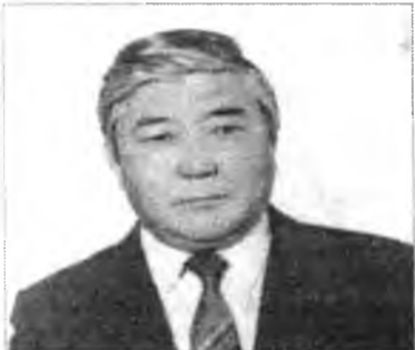
Хурга хэхын забһаргүй Хэрэжэ татаһан хүлигэтэй,

... Хаһаг оодон тэргэдэ Хашасалдаһан бидонууд