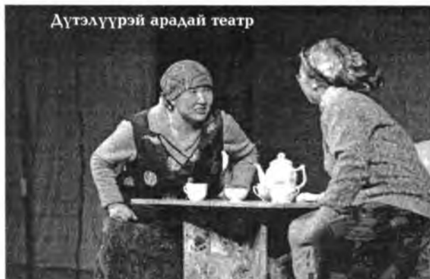
Дүтэлүүрэй арадай театр