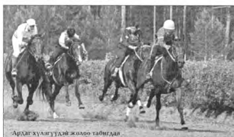
Ардаг хүлэгүүдэй жолоо табигдаа

Залуу хүрэг мэргэшүүл аха захатанайнгаа дүй дүршэлтэй танилсажа, баһал хаба ша-