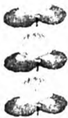
Аха дүүнэр, түрэл гаралнуудшын.