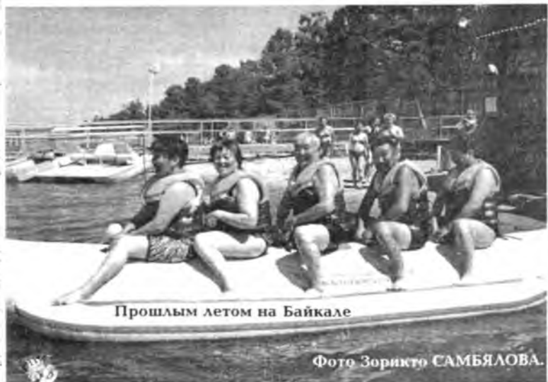
Прошлым летом на Байкале