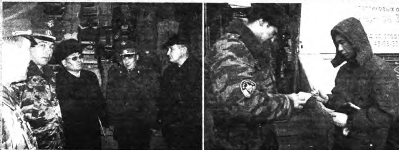
Иностранные торговцы торгуют на рынках города не сертифицированным товаром, в связи с чем цены на их товары ниже, чем у российских продавцов.