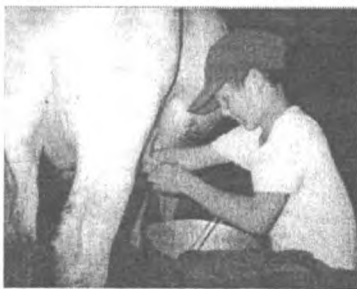
Юный дояр из Тугуна