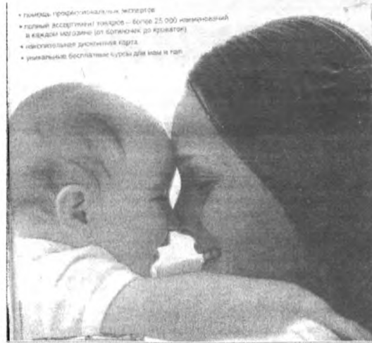
Галерея: профессиональные мастера • годовой ассортмент товаров - более 25 000 наименований в каждом магазине (по сравнению со средним) • инновационная дизайнерская форма • уникальные брендовые курсы для мамы и папы

Что же касается выставки, то она включает три раздела. Первый раздел носит название «Пусть всегда будет мама!» и рассказывает об истории праздника. «Золотая нить семейных традиций» - так называется второй раздел выставки, эпиграфом к которому стали слова О. Бальзака: «Будущее нации - в руках матерей». Он рассказывает о законах, защищающих права матери и ребенка, и обо всем, что с этим связано. Слова Н. Некрасова: «Женщина - великое слово, в ней подвиг матери» стали вступительными к третьему разделу. Этот раздел выставки, названный «Сокровище душевной красоты», представлен произведениями о матери.