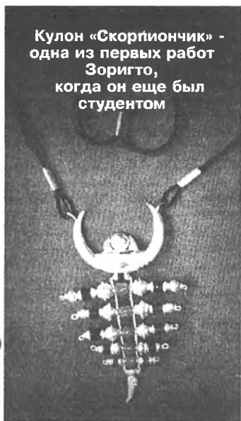
Кулон «Скорпиончик» - одна из первых работ Зоригто, когда он еще был студентом

Сегодня мы хотим представить вашему вниманию новую рубрику «Мастер». В ней будем рассказывать о людях, которые нашли возможность пойти по своему пути, начали свое дело, опираясь на увлечение. Которые, возможно, были первопроходцами в своем бизнесе.