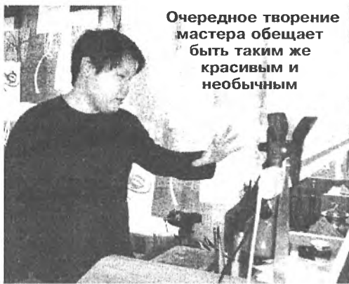
Очередное творение мастера обещает быть таким же красивым и необычным