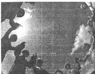
Нарһан, нарһан налаашхаяа Нахилзатарнь хатарая. Найман модонной газарта

«СЭБЭР НАЙХАН ШААСТАЙМНАЙ НААДАН ДЭЭРЭЭ ХҮХЮУТЭЙ...» Суурьян дуутай хуурнай Сэлэнгэ дээрээ сууряатай.