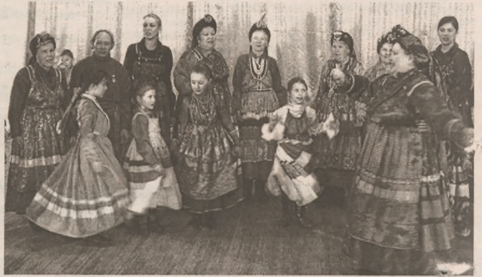
Там люди украшать охочи Карнизы, ставни и венцы. Да так, чтоб радовались очи И слава шла во все концы.

Я вижу удивленным взором, Как проявление волшебства, Цветных наличников узоры, Резных карнизов кружева.