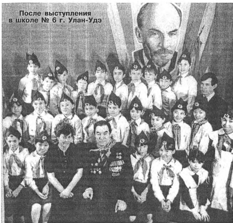
После выступления в школе № 6 г. Улан-Удэ