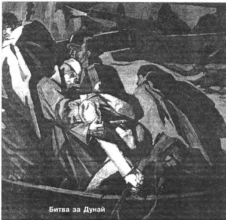
Битва за Дунай