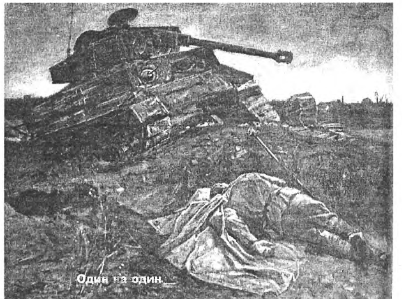
Один на один