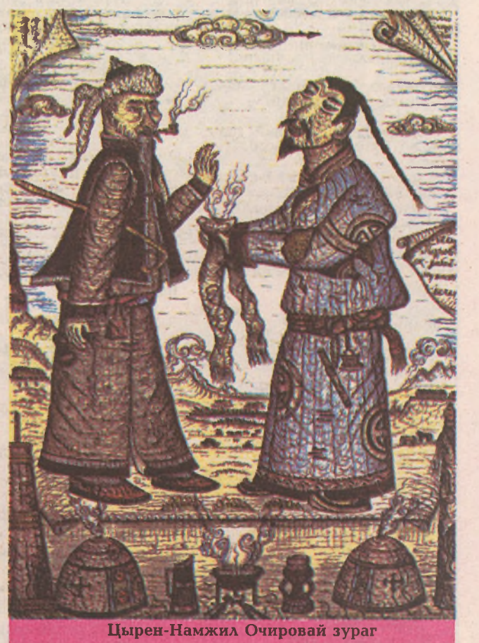
Цырен-Намжил Очировай зураг

Энэ хуудаһа Галина ДАШЕВА бэлдэбэ. Р.Н.БАЗАРОВАЙ зурагууд.