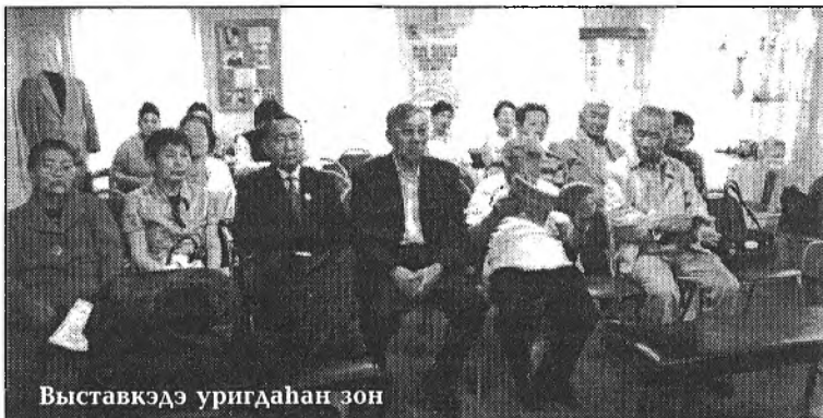
Выставкэдэ уригдаһан зон