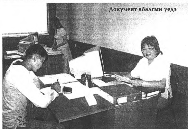
Документ абалгын үедэ