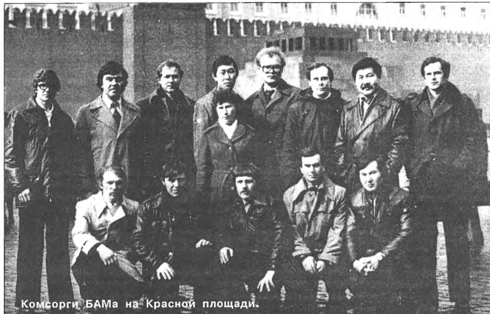
Комсорги БАМа на Красной площади.

Мы, послевоенные дети двадцатого века, «семидесятники», выросшие в пору расцвета советской власти, не запятнаны репрессиями 30-х годов, предательством в военное лихолетье, коррумпированностью и продажностью в 90-х. Это несколько поколений советских граждан, для которых труд на благо Отечества был действительно делом чести, делом героизма и подвига. В нашей жизненной биографии участие в строительстве БАМа занимает особое, почетное место. Советская молодёжь 70 и 80-х годов честно и достойно служила и трудилась на благо Отечества. Её передовой и организованной частью были участники строительства БАМа. Моим товарищам и друзьям довелось вместе со старшими товарищами, гражданами огромной многонациональной державы СССР, в единой, сплочённой, дружной команде принять участие в бамовской эпопее. Это были славные времена.