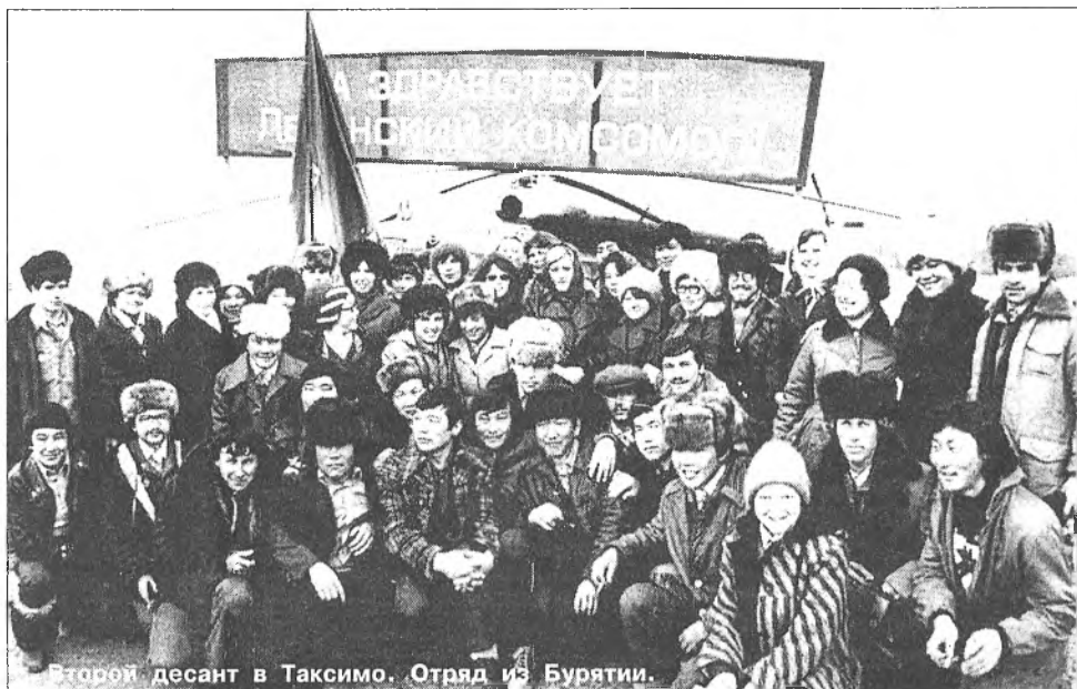
Второй десант в Таксимо. Отряд из Бурятии.