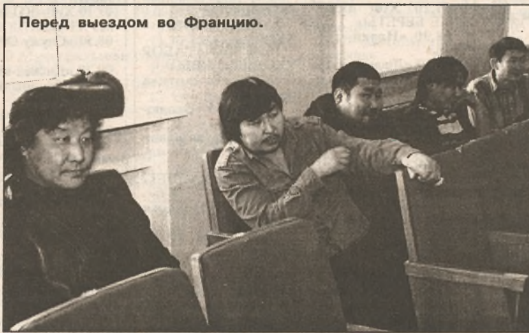
Перед выездом во Францию.