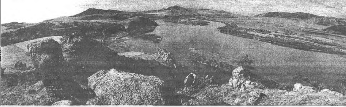
Вид со «Спящего льва» на реку Селенгу.