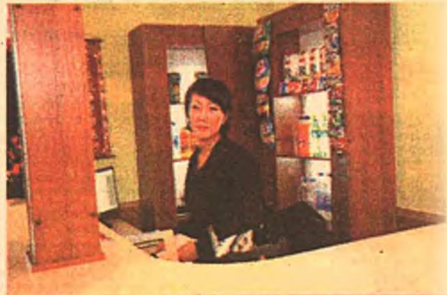
Урин налгай бухгалтер