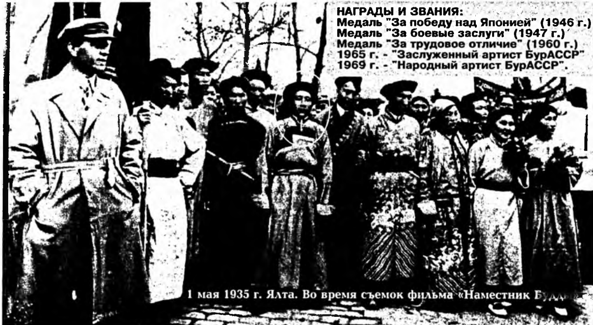
1 мая 1935 г. Ялта. Во время съемок фильма «Наместник Будды»

в Ялту на съемки кинофильма "Наместник Будды" киностудии "Восток-кино". Впервые оказавшись в таком далеком, интересном, богатом впечатлениями путешествии с заездом в Москву, Киев, Одессу, актеры из Бурятии познакомились с архитектурными достопримечательностями городов, смотрели спектакли лучших театров страны - по их воспоминаниям, они просмотрели более 40 спектаклей. Встречи с театральными коллективами, великими мастерами русской сценической культуры - П.М.Садовским, В.О.Массалитиновой, А.А.Яблочкиной, встречи с Н.К.Крупской, А.М.Горьким - каждый день пребывания расширял их кругозор, сценическое искусство раскрывалось перед ними во всем своем богатстве и разнообразии. Домой через полгода приехали выросшие профессионально и духовно, обогащенные впечатлениями.