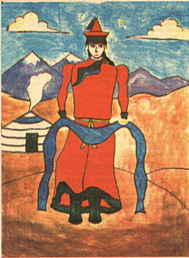
Мункуев Дашинима, 14 лет