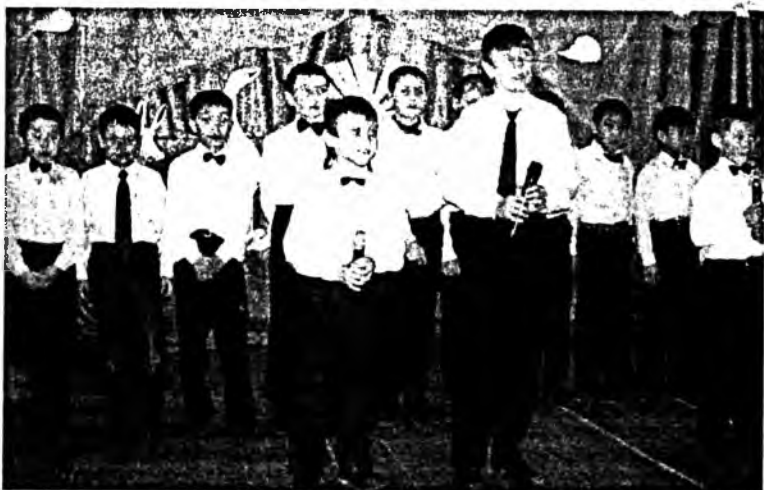
Дурасхаалай удэшин үедэ