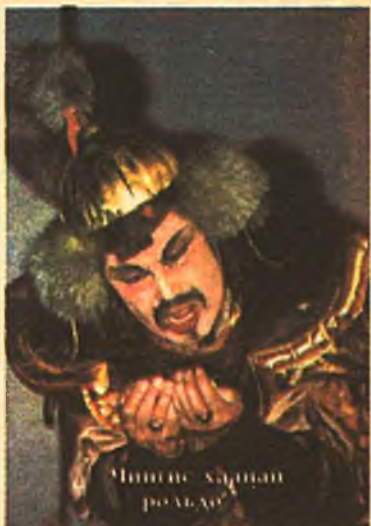
Чингис хаан рольдо