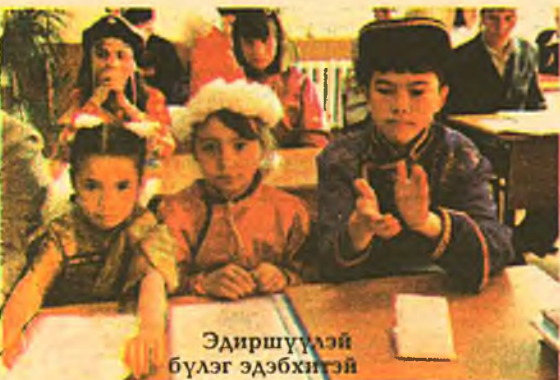
Эдиршүүлэй бүлэг эдэбхитэй