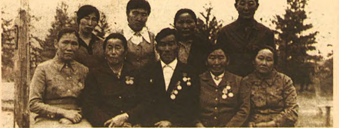
Хуһан-Хушуунай гүүртэ. 1976 он

бэрхээр ажалаа ударидажа, бултадаа эбтэй зетэйгээр шармайн ажаллагша хэн. Миниишые аба эжын тэндэ хүдэлһэн хада, тэрэ үеын хаалишадай ажал һайн мэдэхэ байнаб. Колхоз-баабай тиихэдэ шадалтай гэжээлтэ тарья ехээр ургуудаг, силос гэшые гамгүй бэлдэдэг. Гүүртэ бүхэндэ кормоцех хүдэлхэ, үдэшэ үлгөөгүй үнээн бүхэндэ арбан табанай ведрогоор бурда эднюулхэ.