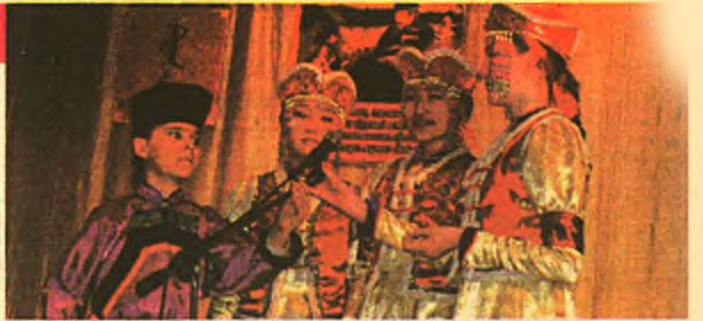
"Эрхим багша - 2009"

Улаан-Үдын хургуулинуудта буряад хэлэ заадаг багшанарай дундаһаа эгээл эрхимыень элирүүлгын мурьсөөн анха түрүүшынхией үнгэрбэ. Хабаадаха хүсэлтэйгөө мэдүүлхэн багшанар хэшээлнүүдтэ хэрэглэдэг онол аргуудтаа танилсуулаа, мүнөө угаа дэлгэрэнги болонхой проектнэ хүдэлмэринүүдээ харуулаа. Мурьсөөнэй гурбадахи шатада хабаадагшад нэмэл хэшээлнүүдые үнгэргөө. "Миний оршон дэлхэй" гэхэн мурьсөөнэй нүүлшын шатада 12 багша үлэхэн байна.