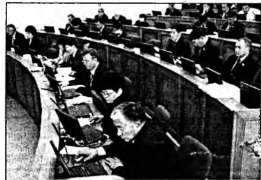
аграрна политикын болон эд хэрэглэлгын дэлгүүрэй талаар хороон (Түрүүлэгшэнь В.А.Павлов)

Зүблэхэ зүйл: 1. «Буряад Республикада хүдөө ажахын үйлдбэрине гүрэнэй талаһаа дэмжэхэ тухай» Буряад Республикын Хуулийн 15-дахы статьяда хубилалта оруулха тухай» Буряад Республикын хуулийн түлэб тухай