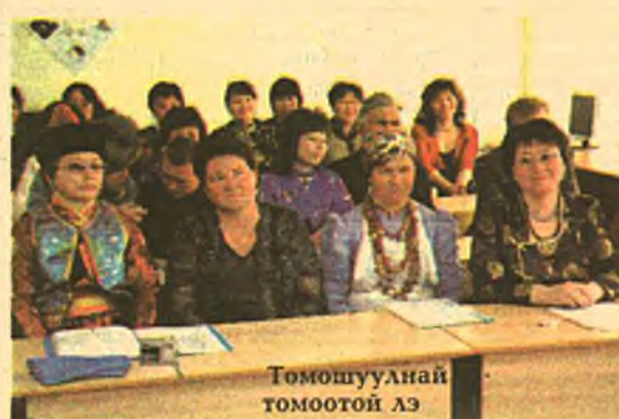
Томошуулнай томоотой лэ