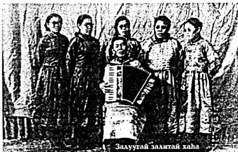
Залуугай залитай хаха

-Дэлхэйн олон янзын голоңго, Улаан Хадын сээсэгүүдэй үнгын