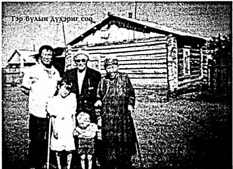
Тэр бүүн дүхэриг соо