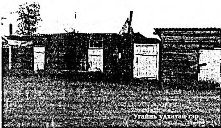
Угайнь ухатай гэр

Иаалтын хайндэр - майн юһэнэй үдэр урдынхидаал адли сэдхэл зүрхэндэ хаха оромо, нур жабхалантайгаар орожо ербэ. Тэбэрижэ хүртэшгүй томо улаан наран зүүн хадын налоухан хярхаг дээгүүр холжорон гараад, юһэн саг багта элшэ туяагаараа дулаасуулжа захалшаба. Тэнгэридэ малгайншые зэргэхэн үүлэн үгы. Тосхоной баруун хойто зүгһөө, таряалан тээһээ, тракторнуудай ажалай хүгжэм хонгор сэлмэг агаар дамжан, долгион ерэнэ. Нютагай баатар хүбүүдэй дурасхаалда табигдаһан хүшөөгэй хажуугаар шара үнгэтэй автомашина дүнгинөөд үнгэршэбэ. Эгээл иимэ ажалша,