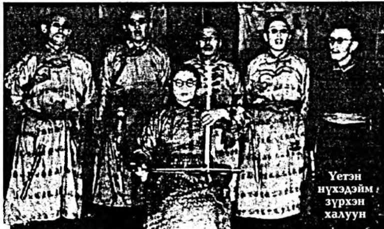
Үетэн нүхэдэйм зүрхэн халуун