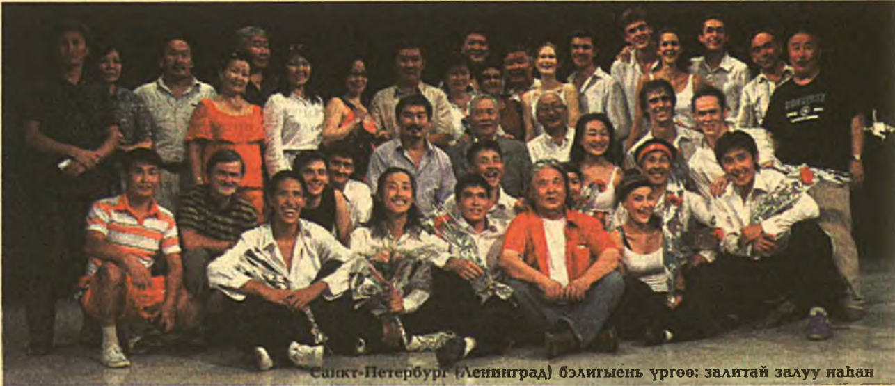
Санкт-Петербург (Ленинград) бэлигыень үргөө: залитай залуу наһан

Һаяхан Санкт-Петербургын Гүрэнэй театрай академиин 3-дахи курсын оюутад (4-дохи национальна студи) сүт хурадаг нүхэдтээ Улаан-Үдэ ерэжэ, июлиин 22-то, 23-да «Бидэ - артистнууд, хүгжэмшэд, акробадууд, шогтой зон...» гэһэн концерт-шоугайнгаа программа залаар дүүрэн хүн зоной, харагшадтай, нютагаархидайнгаа урда харуулба.