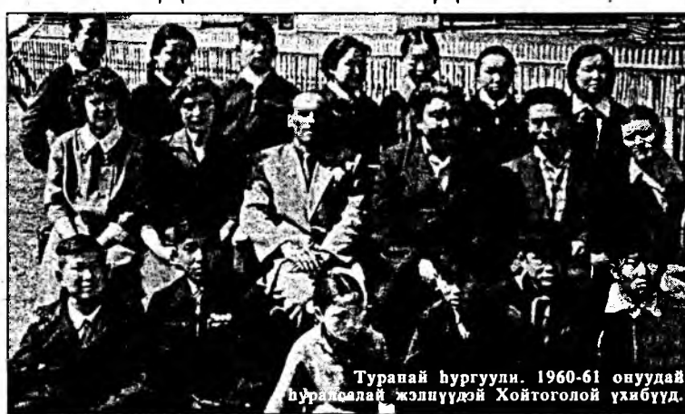
Туранай хургуули. 1960-61 онуудай хуралсалай жэлүүдэй Хойтоогой үхибүүд.

1909 ондо Туранай хургуулин амар шэнжэ шарайтай байһыень, түүхэ домогыень найн онсолон мэдэхгүй дээрээ энэ хургуулин түүхын багшанар тодорхой тэдгээр хонирхоһон зондо ойлгуулан, түүхыень бэ-шэнэ бээ гэжэ найдаад, 50 жэлэй саада тээ энэ хургуулида хуража ябанаа бэшэхэ дуран хүрэнэ.