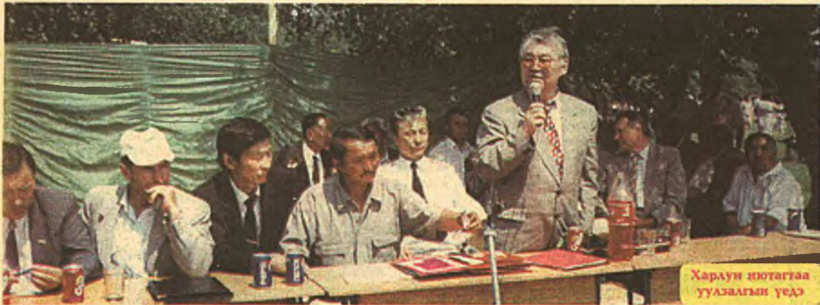
Харлан нютагтаа уулзалгын үедэ

- Асуудалнууд үгы! - гээд, шангаар харюусахаданни, хажуу-