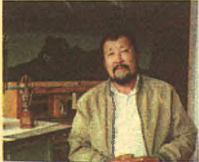
ЗҮНТЭЙ ҺЭН ГҮ, ЗУГЫХЭНИИНЫ

...Гурбатайхандаа мэдэрэл ороноо Чингис ямар нэгэн хайрата найхан үзэгдэл мэтээр ханадаг. Далахай нотаганаан дээшээ зулалан нэмжыхэ. Одоол эндэ орбоггорхон гэрхээ гараад, нюдэ булямаа үнгин сээсэгүүдые найхашаан хаража байтараа дэлыбэхэн дээрэ хууһан эрзэн-марьяан зүгье обёржо, барижархиха хүсэлтэй гараа нарбагад гүүлэхэдэн, тэрэн хадхархарха. Одоо ямар шашхаан болоо нэм, ухаандан элээр хадугдаханиинь жэгтэй. Зүнтэйхэн зүгй зураашын зурхайтайш гэжэ мэдүүлэн, зурагас гэтэр зүрхэндэн оруулхан байгаа бэшэ аал!