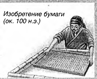
Изобретение бумаги (ок. 100 н.э.)

История китайской цивилизации началась примерно за 1500 лет до н.э. За несколько веков Китай превратился в необъятную империю. Открытия китайцев в области науки и техники, китайская философия внесли заметный вклад в историю человечества.