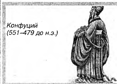
Конфуций (551–479 до н.э.)