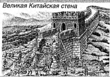
Великая Китайская стена