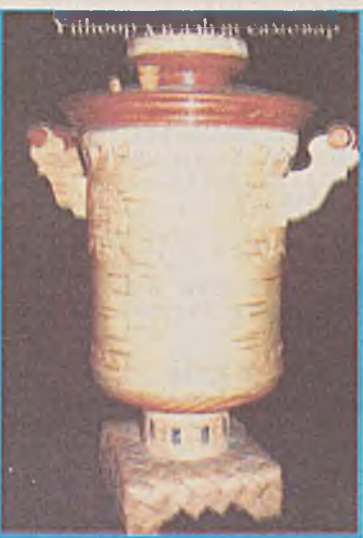
Үйһөөр хууһанай саговар

Хуулан абаһан үйһые Хараха барихада аятайхан, Хэгдэһэн зүйлнүүдынь галтайхан Хамаг зондоо домогтойл. Бэсын тамирта нүлөөтэй Бамбар, зөөлэн үйһэн. Бодол, сэдхэл баясуулдаг, Байдалые шэмэглэн гоёдог Буряад зоной баялиг юм.