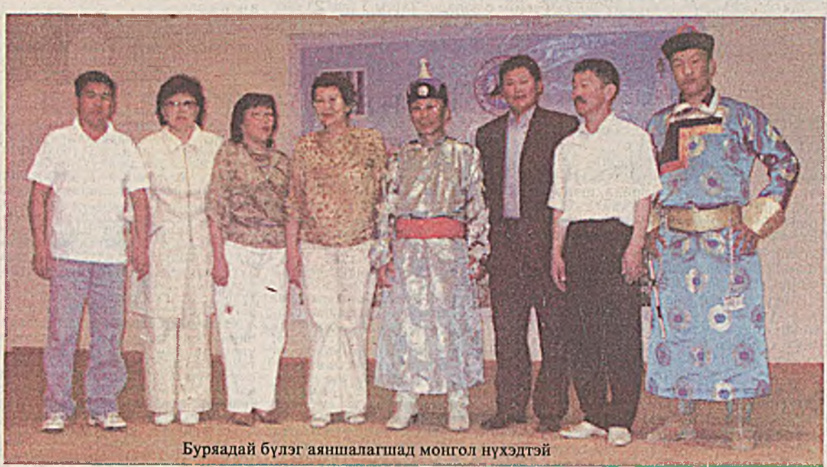
Буряадай бүлэг аяншалагшад монгол нүхэдтэй