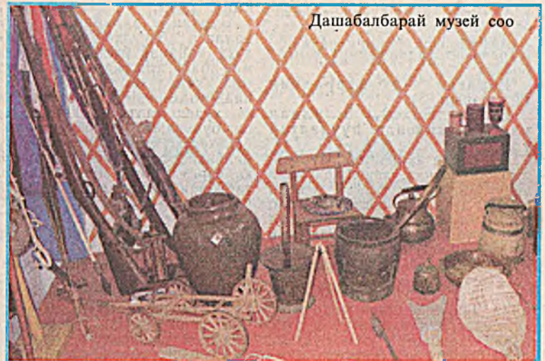
Дашабалбарай музей соо

флаш – иимээр өөһэдтөө тааруугаар ойлголсодог юм байна.