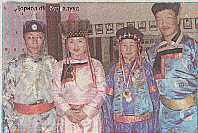
Дорнод ой буряадууд

Хэр үгһаа буряадууд хүүгэдэ хургаха гэжэ оролдодог, хүүгэдтэ энхэргэн зөөлөнөөр хандадаг. Бүри баһаань арадай дуунуудта хургана, таабаринуудые таалга-