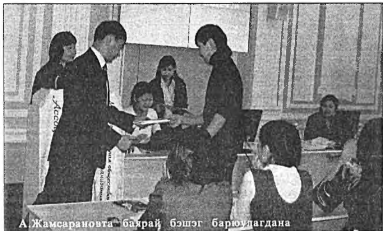
А.Жамсарановта баярай бэшгэ барюулагдана