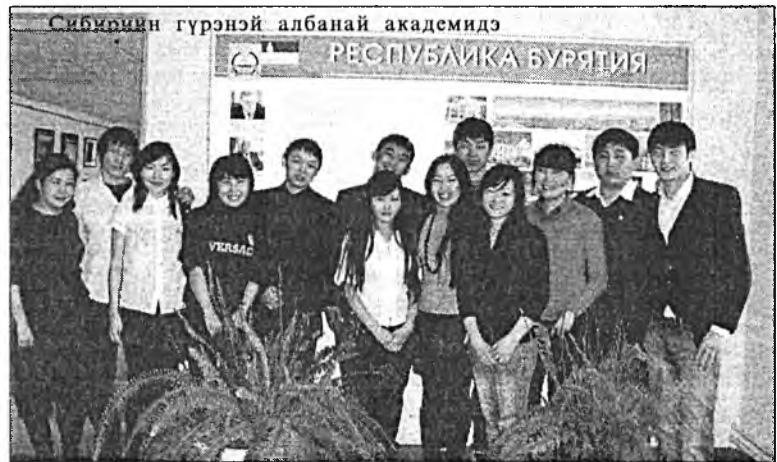
Сибириин гүрэнэй албанай академидэ РЕСПУБЛИКА БУРЯТИЯ