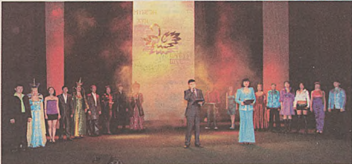
«Мүнгэн хун шубуун» («Серебряный лебедь») гэжэ эстрадын дуунай регионууд хоорондын конкурс байгша оной мартын 16-наа 19 хүрэтэр «Феникс» гэгэн соёлой түбтэ (юрид ород драмын театр байгаа) хоёрдохийо үнгэргэгдэбэ.

Эрхүүгэй областин, За- байкалийн хизаарай, Усть- Ордын, Агын Буряадай той- рогой дуушаднаа гадна рес- публикын хүдөө нютагууднаа хонгёо найхан хоолойтой ба- сагад, хүбүүд ехэ олоороо ха- баадаа. Үшөөшье олон байха аад лэ, арбан долоотойгоо эхилээд 27 хүрэтэр наһанай залуушуул хабаадаха гэжэ хизаарлагдадаг байна. Тии- гээбэ яабашье, республикын багшанарай колледжын ак- това залда үнгэргэгдэнэ кон- курсын нэгэдэхи шатадань