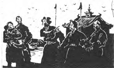
БУЛАВИН (руку ложит на лбу Бадана): Я, Бадан! Терпеть надо тебе. Теперь ты у нас в остроге. Ладно, мы тебя живого нашли, лечись обязательно, лежи, отдыхай.

БАДАН (слабым голосом): Василий, это ты?