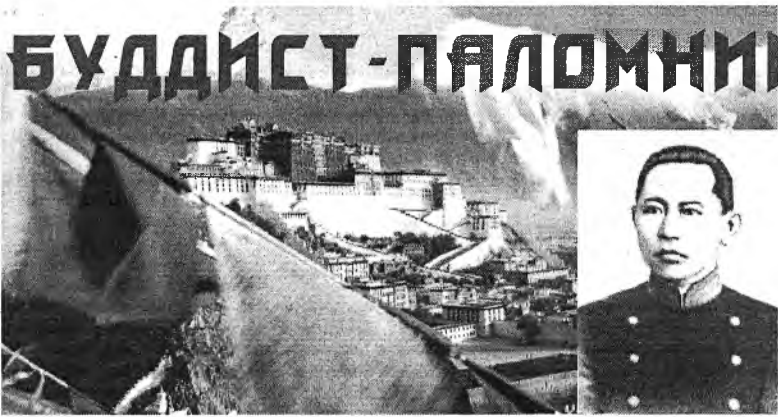
5. Двух лент из ниток, нанизанных жемчугом, у богатых — настоящим, а у менее зажиточных — поддельным.

4 Дарджилинг - город в Сиккиме, который служил летней резиденцией английского генерал-губернатора Индии в Калькутте, куда в 70-х гг. XIX в. была подведена железная дорога и где был открыт англичанами крупный торговый рынок. Дарджилинг служил опорным пунктом английской экспансии в Тибете в конце XIX - начале XX в.