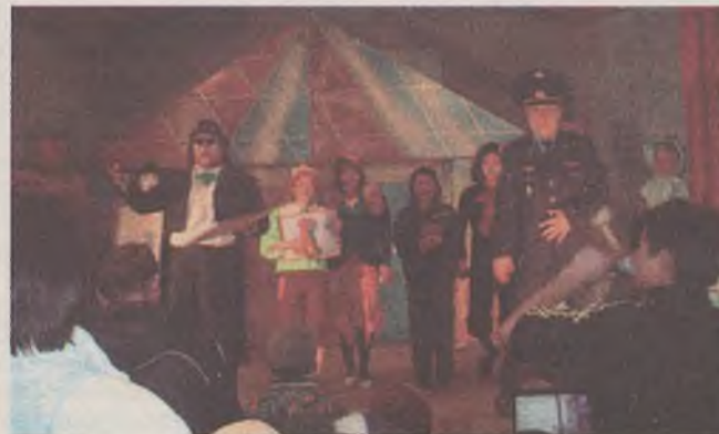
Буратино тухай зүжэг