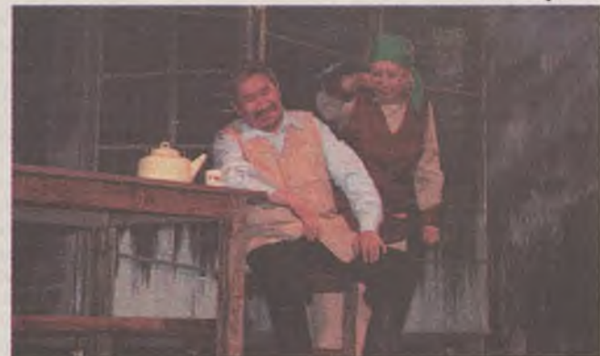
«Эртын хабар» зүжэг