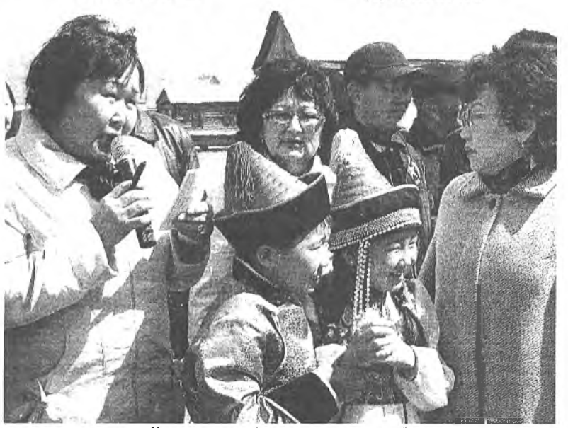
Ульдэргын багшанар урматай