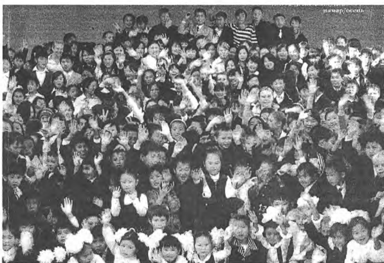
Эхнһээ найханаар ланагадаг Энэрл хайрата хургуули

рүүшын бүлэг үхибүүд дүүргээ лэн. Харин 1976 ондо юрэнхы дунда хургуулине түрүүшын ехэ бүлэг үхибүүд дүүргэжэ гараа. Юрэнхы эрдэмэй интернат-хур-гуулийн байгуулагдаһан саһаа хойшо 14 выпуск хэгдэлэн бай-на. Мүнөө үедэ манай хургуули дүүргэгшэд түрэл оронойнгоо болон республикын үргэн ехэ нотагуудаар амжалтатой хү-дэлнэ. Россин габыята артист, Гүрэнэй академичекэ Буряад драмын театрай директор Д.Н.С.Сультимов, Буряад Респу-бликын соёлой габыята хүдэл-мэрилэгшэ, «Буряад үнэн» гэгэн сонинной редактор байһан, уран зохёолшо Ц.Б.Цырендоржиев, Буряадай гүрэнэй хүдөө ажа-хын академийн механизацийн фа-культетэй декан байһан, тех-ническэ эрдэмэй кандидат Ц.Ц.Дамбаев, республикын га-быята багша, РСФСР-эй гэгээ-рэлэй отличник Б.С.Галанов бо-лон бусад.