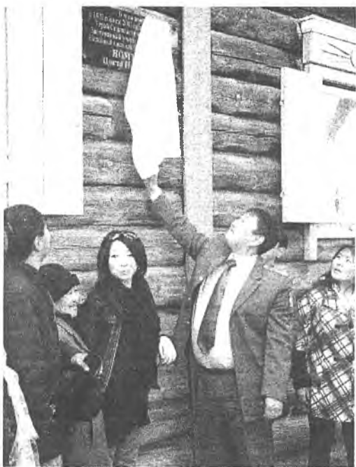
Дурасхаалай самбар нээгдэж байна

«Сэсэриг орондоо Сибирьтэ оршодог Ульдэргэ үржэлтэй баян, үнэр тэнюун нютагнай, анхан сагнаа амидаран нютагжанан арадшин ариун сэдхэлтэй, ажалша найхан заншалтай», - гэжэ Ц.Н.Номтоевой шүлэгүүдэй мүнрүүдээр зоной зулай болонон алдарта багшымнай 100 жэлэй нангин оёе хүндэлжэ, булган захата Буряад оройнойгоо булан бүхэн-нөө шамдажа, хуһан модон сэргэдэмнай хурдан хүлэгүүдээ тулганан, ямба ехэтэй айлшадтаа яруунаархитай зүгнөө амар мэндэ!