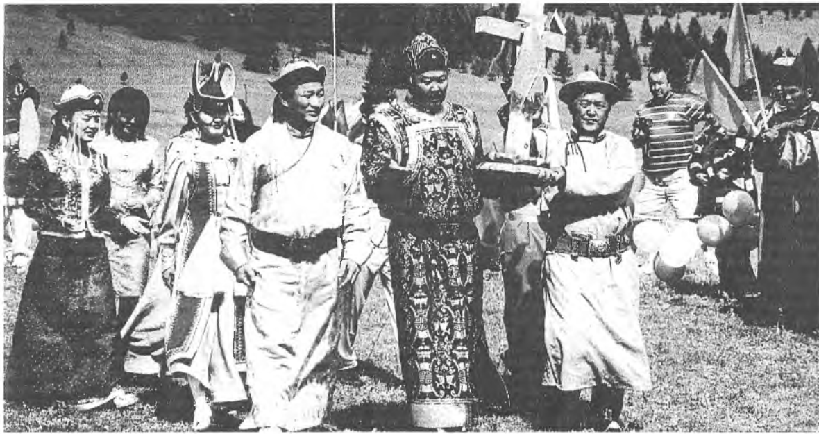
Конвент монголов мира состоится в июле месяце с.г.

В газете «Номер Один» № 42 от 18 октября 2006 г статья «Группа крови — зеркала человека и его болезней» написано: «III группа крови возникла около 15 000 лет до н.э., когда некоторая часть Гомо Сапиенс была вытеснена из жарких саван Восточной Африки в холодные, бесплодные