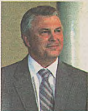
Генеральна сессийн хүндэтэ хабаадагшад!

Буряад Республикада түрүүшынхээ үнгэргэгдэх дэлхэйн монголшуудай Дээдэ хуралай Генеральна сессидэ хабаадаха Та бүгэдэндэ хандажа, нүлөө ехэтэй уласхоорондын, гүрэн түрэн бэшэ эмхи гэжэ мэдэржэ байханаа онсо тэмдэглэхэ байна. Монголшуудай Дээдэ хурал хадаа монгол туургата арадуудай үндэһэн ёно заншалуудые, түүхэ, хэлэ бэшэг болон соёл бүрин зандань үлөөхэ талаар горитой хүдэлмэри ябуулна. Монгол ороной мүнөө байһан Президент хадаа энэ Дээдэ хуралай хүндэтэй президент байһаниинь энэ эмхиин улам дээшэлжэ байһан политическэ удха шанарынь болон үүргэ нүлөөнь гэршэлнэ.