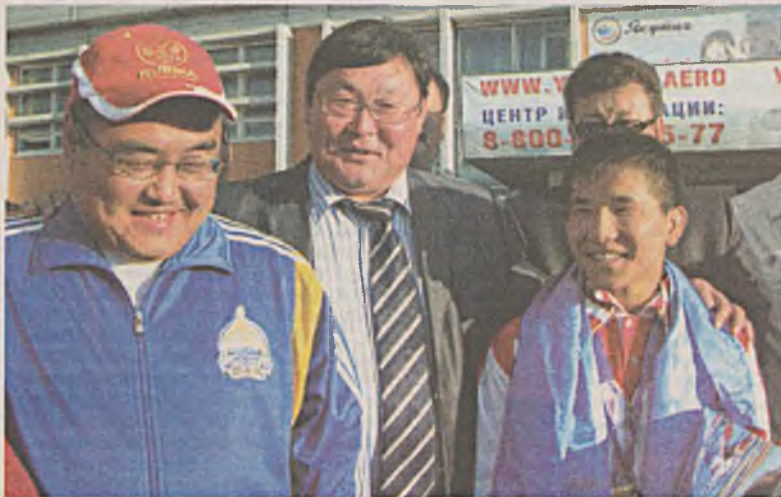
Хэжэнгын гулваа Э.Бадмаев Олимпин чемпионтой