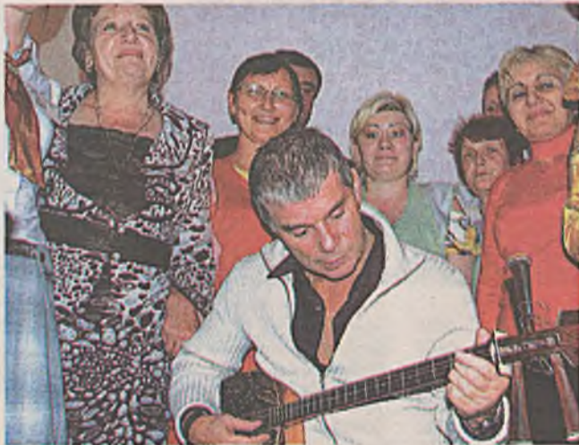
Олег Газманов Гусиноозерск хотодо