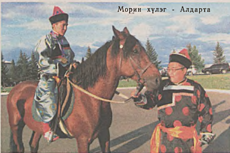
Морин хүлэг - Алдарта