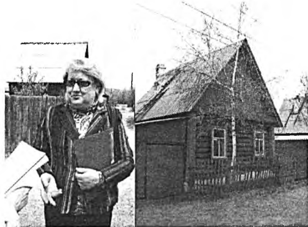
Мэриин мэргэжэлтэн «Черемушки» дача дээрэ

Тоо бэшэлгэн гансаараа гэртэтнай ерэхэ бэшэ, хуули сахигша мэргэжэлтэнтэй орожо ерэхэ.