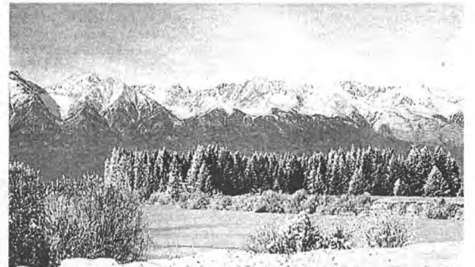
Вид на Иркут и Тункинские гольцы из п. Жемчуг

реки Иркут, откуда открывается великолепная панорама Саянских гор. Чистый воздух, ароматы степных трав, минеральные источники, экологические чистые продукты питания - все это располагает к приятному и полноценному отдыху.