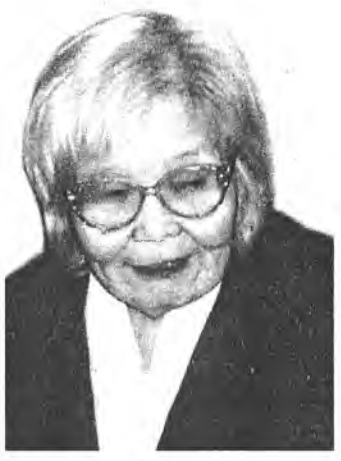
«Намһаа бү айгыш, нүхэр, хуу дуулаалби. Намдаа найдыш, хэлэһэн үгыеш хадугаалби. Худа урагайшые һабагша хоорондомнай байха. Хубаажа олоёо абаялши, һайн байха!»

Шэйэ тушаалдаа хэдэн хоногто тэсэмгэй Шэмээ шууяагүйгөөр үнгэргэбэл даа Миисгэй. Алаг Миисгэй тиигһээр ажалдаа дадаба. Амбаар соохоно мяханай байһые мэдэбэ. «Мяа-а-а-уу-уу, мяа... шарамни бусалшоо ехээр. Мяханһаа хүртэжэрхибэл, гоёл һэн бэлэй». Ажалгүй Үнэгэн гэгтэ гүйжэ ерһээр, Аргагүй шарбалзан, ниигэе Миисгэйдэ хэлтэ: