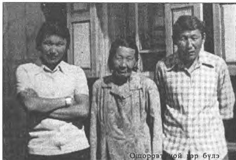
Ошоровтой гэр бүлэ

Багаһаа хойшо Лопсон эжы, абадаа наринаар туһалжа эхилээ. Гэхэтэй хамта, хуралсалаа алдадаггүй нэн. Тэрэ 1967 ондо Элтэгшэнэй эхин хургуулин богоһо алжажа ороо. Эхин классууды ерхмээр дүүргээд, Горхойной дунда хургуулида хуралсалаа үргэлжэлүүлээ. 1977 ондо дунда хургуули дүүргэхэдэнь, ЦК ВЛКСМ-эй тэмдэгээр эрхмээр хураһанай түлөө шагнагдаа.