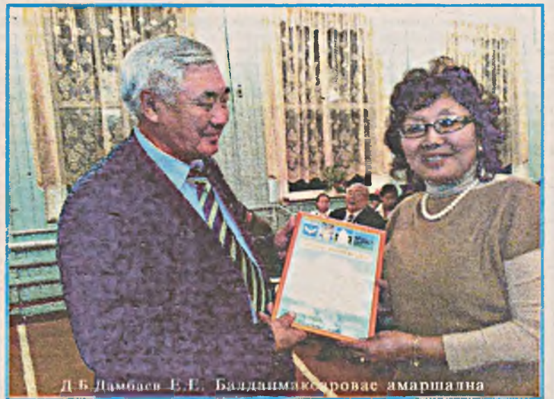
Д.Б.Дамбасв Ф.Е. Балданмаксаровае амаршална