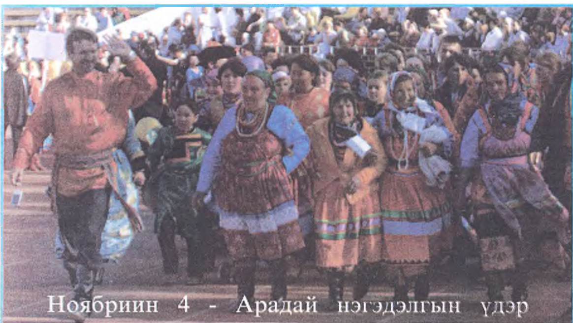
Ноябриин 4 - Арадай нэгэдэлгын үдэр

Манай сонин Россин хэблэлэй алтан жасада оруулагданхай