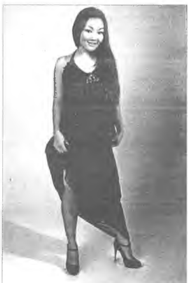
ФОТО ЗУРАГ ДЭЭРЭ: конкурсдо хабаадагшад.

Багшанарай методическа үүсхэлнүүдэй республиканска выставкэ-яармагта зуугаад түрүү багшанар хабаадаа. Тус хэмжээ ябуулгын эмхидхэгшэд - Буряад Республикын Пуралсалай болон эрдэм ухаанай министерство, Эмхи зургаанай болон хуралсалай кадрнуудай мэргэжэл дээшлүүлжэ республиканска институт.