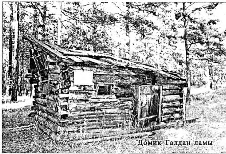
Домик Галдан ламы

У подножья Баргузинского хребта между селами Ярикто и Элысун расположен замечательный аршан Буксыкен. Эти места святы, по рассказам местных жителей. Сюда приезжают молиться семьи одного рода или племени. Наверху есть шаманские захоронения, где находили эвенкийские и шаманские короны и другие предметы. Здесь примечательно место, которое я бы назвала садом камней: во времена ледникового периода сверху со снегом и льдами скатывались камни, округляясь при падении. Это древнее засохшее русло сохранилось и по сей день, видимо, большие снега и льды образовали мощный поток. В последнее время в горах Баргузинской долины такого снега нет. Раньше снежные и ледяные вершины наших гор всё лето не таяли. Не бывало лесных пожаров, потому что земля всегда была мокрой и сырой. Когда идешь по лесу, там и тут сохраняется снег, особенно по берегам ручьев. В сильную жару они таяли, конечно, но вечная мерзлота была очень сильной: даже летом идешь по болоту, а внизу чувствуешь ногами лёд. Природе нанесён непоправимый ущерб вследствие беспощадной вырубке лесов и других необдуманных дел.