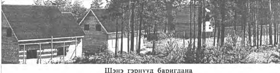
Шэнэ гэрнүүд баригдана

Тийн иймэ мүнгэ түлөөд, үшөө хажуудань гэр руугаа утаһа татаха болоо наа, баһал мүнгэ гаргашалха болоно.