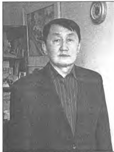
Мүнөө энэ сагта, газар дэлхэйн нэгэн боложо (глобализация) байхада, хүсэтэй арадуудын эзэн боложо, тулюур арадуудын барлаг боложо, муу, हुла хүнүүд элдэбын хоротой архи, тамхи, муухай эдэс эдижэ (генетически модифицированные продукты), хосоржо үгы боложо байха сагта, энэ бэшэгдэһэн бисалгал, хургаал хэрэгтэй болохо байна бшуу.

Энэ бисалгал буряадаар: «Зүүн зүгэй зарин дайшалхы эрдэмэй бисал-