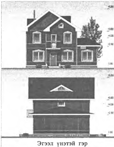
Эгээл үнэтэй гэр

- Залуушуулай 200 мянган түхэриг түлэхэ аргатай байгаа наань, уһан бүри түргөөр бии болохо ааб даа, - гээд тэрэ хэлэнэ.