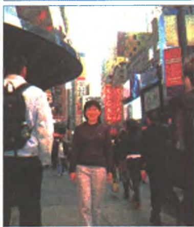
Нью-Йорк. 2009 г.