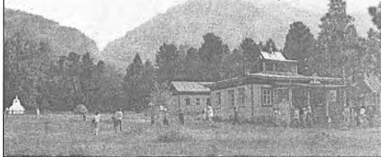
Хойморский дацан «Бодхидхарма», пос. Аршан, Тункинский район.

в последние годы, когда получила развитие новая экономика с ее прагматизмом и глобальным характером, один из объектов - гора Мунку-Сардык - стала привлекать внимание жителей не только соседних, но и отдаленных регионов, включая представителей различных конфессий. На вершине священной для бурят и сойотов горы устанавливаются несанкционированные и не связанные с традиционной историей и культурой этих мест сооружения. Все это вызывает беспокойство коренных жителей Тунки и Оки. Межконфессиональное и межнациональное согласие и в Бурятии не должно нарушаться. Об этом, в частности, говорилось на международной научно-практической конференции «Межконфессиональные отношения на рубеже тысячелетий», прошедшей в июне 2007 г. в Бурятском государственном университете.