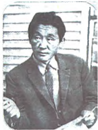
(Түгэхэл. Эхининь № 10 (722), 11(723), дугаарнуудта).