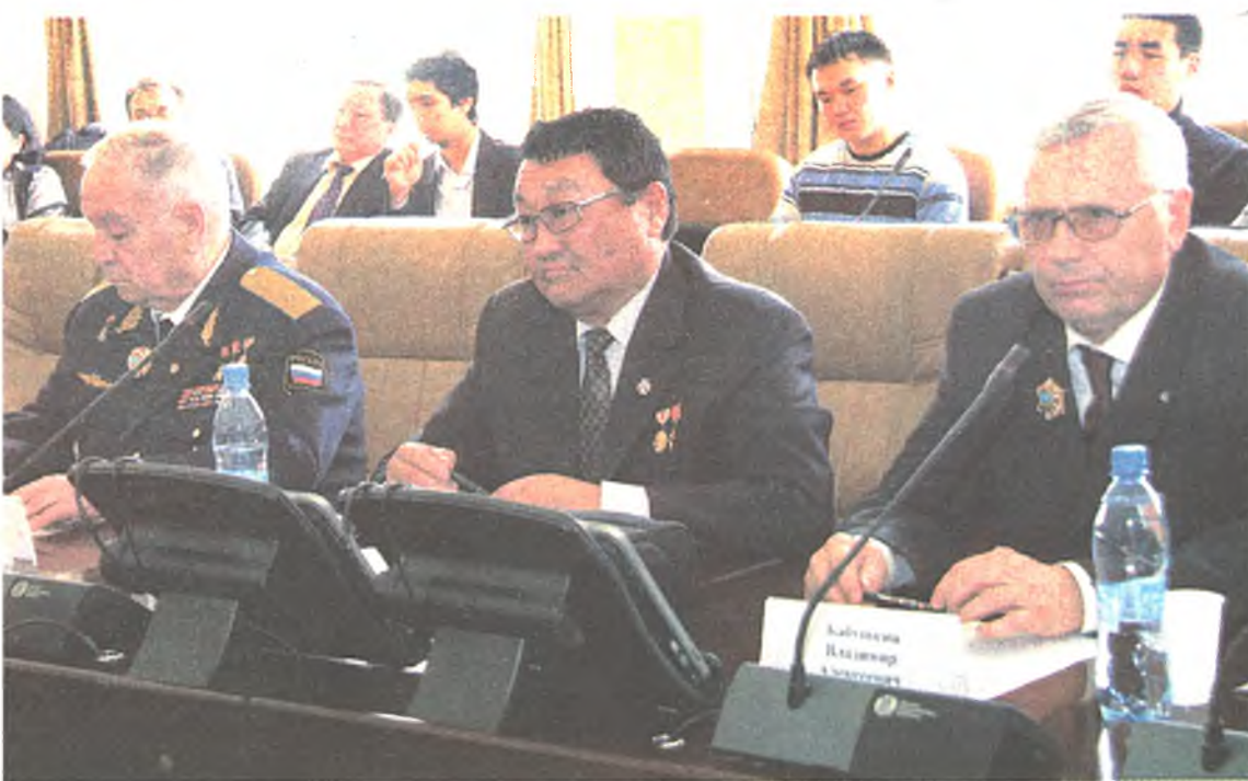
Мартын 22-то хүршэ гүрэнэмнай Россин-Монголой экипажай суг хамта замбуулин ниидһээр 30 жэлэй ойн баяр үргэнөөр тэмдэглээ. Тиин мэдээжэ космонавтнууд - Советскэ Союзай гурба дахин Герой, Монголой болон Вьетнамай Герой Виктор Горбатко, мүн Монголой болон Советскэ Союзай Герой Жугдэрдемидийн Гуррагча гэгшэд Улаан-Үдэ хото ерээ юм.

Генерал Ж.Гуррагча гүрэнэйгөө космическа программын хүтэлбэрлэгшэдэй нэгэн, оборонын министр, Агууехэ Гүрэнэй Хуралай депутат байһан. Мүнөө Монголой түрүүшын болон ори ганса космонавт Хани Барисаанай монгол бүлгэмүүдэй холбоо хүтэлбэрлэнэ. Тус бүлгэмэй урилгаар Виктор Горбатко түрүүтэй Россин космонавтууд ойн баярта хабаадаа. Эдэ хэд бэ гэбэл, Советскэ Союзай хоёр дахин Герой, Монголой Герой генерал-майор Владимир Джанибеков, Афганистанай Герой полковник Владимир Ляхов, Монголой болон ГДР-эй Герой генерал-полковник Владимир Коваленок, Монголой болон Болгарин Герой, техническэ эрдэмэй доктор, РАН-ай гэшүүн-корреспондент Виктор Савинных болоно. Улаан-Баатар, Эрдэнэт болон Дархан хотонуудта тус үйлэ хэрэгтэ зорюулагданан Россин уран бэлигэй түлөөлэгшэдэй фестиваль эмхидхэгдээ, айлшадта Монголой Президент Дайшалхы Улаан Тугай орденууды зүүлгээ.