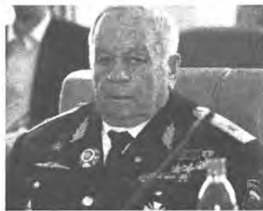
- 7 апреля приглашен в город Гагарин, там будет Путин, представители Роскосмоса. В марте я

Мир готовится широко отметить 50-летие первого полета человека в космос. Делегации советских и российских космонавтов – а их 108 – после 12 апреля разведутся в 48 государств. Дважды Герой Советского Союза, Герой Монголии и Вьетнама генерал-майор Виктор Горбатко из того знаменитого первого отряда космонавтов. Из 20 человек в космосе побывали только 12. Из них остались четыре человека и сегодня, в канун полувекового юбилея события, перевернувшего мир, они нарасхват, все хотят встретиться с ними.