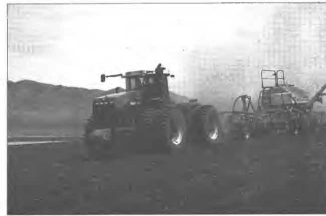
Агропромышленна комплекс: байдал хэр бэ?

лоошод ехэ сагаа гээнгэ. Правительствын хүдэлмэрийн дүнгүүдээр эндэ тоосоһон республикын толгойлогшо В.Наговицынай хэлһээр, эндэ транспортын ябадаг харгы үргэдхэгдэхэ ёһотой. Тиихэдэ нэгэ доро хэдэн машинанууд түмэр хар-