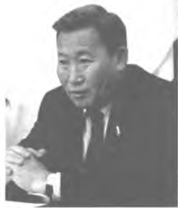
ХҮНДЭТЭ НЮТАГААРХИД, УЛААН-ҮДЫН АЙЛШАД!

Та бүгдэниие хани барисаанаймнай 350 жэлэй ойн баяраар амаршалнаб!