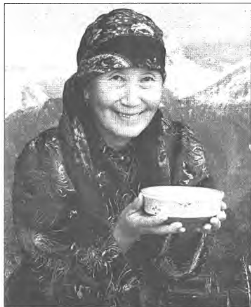
СЛИВОЧНОЕ МАСЛО «ТО ҺОН» За скотом ходить - сытым быть. (Пословица)

Сметану мешают мутовкой до появления шариков масла, которые всплывают на поверхность. Затем добавляют воду, чтобы масло лучше отделялось от жидкой основы пахты. Сметану сбивают обычно в теплом месте или на медленном слабом огне. Готовое масло скатывают в круглые комочки весом около 500 - 900 г. Хранятся круглые комочки масла в берестяных туесах на холоде.