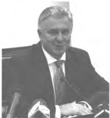
БУРЯАД РЕСПУБЛИКЫН ХҮНДЭТЭ АЖА ХУУГШАД БОЛОН АЙЛШАД!

Буряад Республикын Правительствын болон өөрынгөө зүгһөө та бүгдэниие Буряадай Росси гүрэнэй бүридэлдэ ороһоор 350 жэлэй ойн баяраар амаршалнаб.