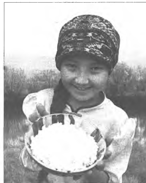
с ослабленным после долгой болезни здоровьем, добавляйте в напиток жирные сливки и сахар.