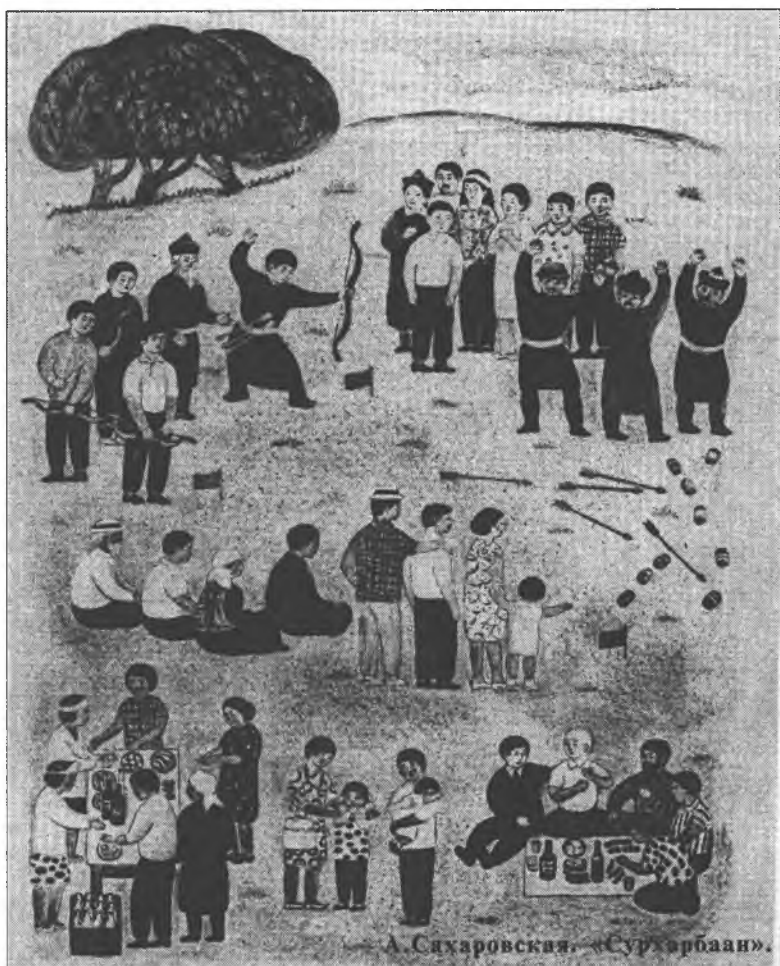
А. Сихаровский. «Сур харбаан».

Тэгшээр зурыһан хорин бүлэнэй Тэгэн дунда хүндэтэй ямбатай