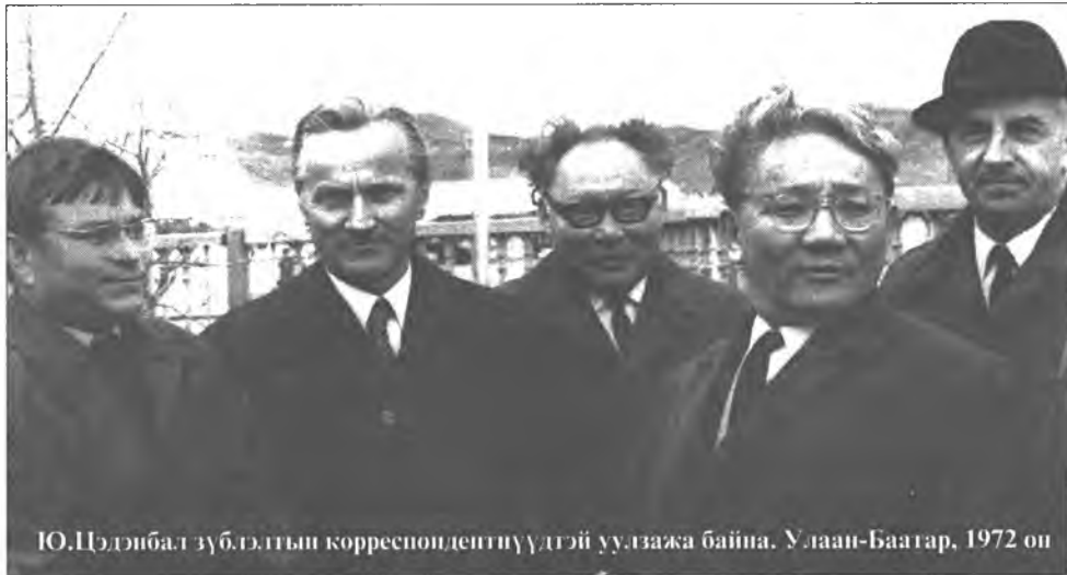
Ю.Цэндэбал зүб.г.тын корреспондентнүүдтэй уулзажа байна. Улаан-Баатар, 1972 он

пулаадаар зохидоор тааруулжа уянхай. «Энэ бабагартай намайе буулгалши», - гээд Хоца Намсараевич нэмээхэн гарыем татаа хэн. Зурагыень хоёр дахин абабаб. Ород хэлэн дээрэ ойлгуулжа биранагүй хаб гэжэ тухайлхадаа, тэрэ нүхэрнай миний барижа байһан ручка абаад, блокнот дээрэмни: «Сант Синг Секхэн. Пенджаб» гэжэ ехэл оролдосотой удаанар бэшэжэ үгөө бэлэй. Уданшьегүй шаралгы торгон үндэһэнэй хубсаһатай, урин налгай, нюдөөрөө энеэбхилһэн эхэнэр манай ханиие яралтайгаар гараараа зангажа байгаад дуудаба. Энэнь һүүлдэ мэдэхэдэмнай, Энэдхэг ороной сууга уран шүлэгшэдэй нэгэн Амрита Притам гэдэг байгаа хэн. Делегацияраа хайшаашыб ошохо болоод, манай «бабагары» бэдэржэ ябана гэжэ тэдэнэй оршуулагша тайлбарилба.