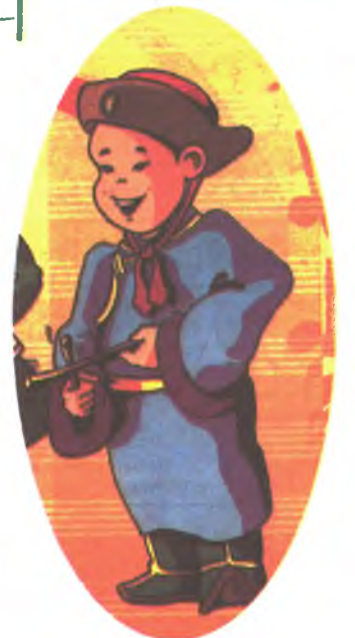
намгад хүбүүгээ булалдажа ерэхэ. Хэнэйн хүбүүн байгаа юм, бү