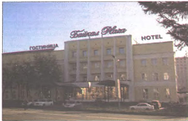
«Байкал Плаза» олон айлшадые угтан абадаг

Залуу мэргэжэлтэнэй хэлһээр, Буряадта аяншалга хүгжөөхын тула ехэ ажал ябуулха хэрэгтэй. Ондоо хотонуудта ошоод харахада, тон ондоо байна. Тэндэхи мэргэжэлтэд ажалдаашы ондоогоор хандаг байһана.