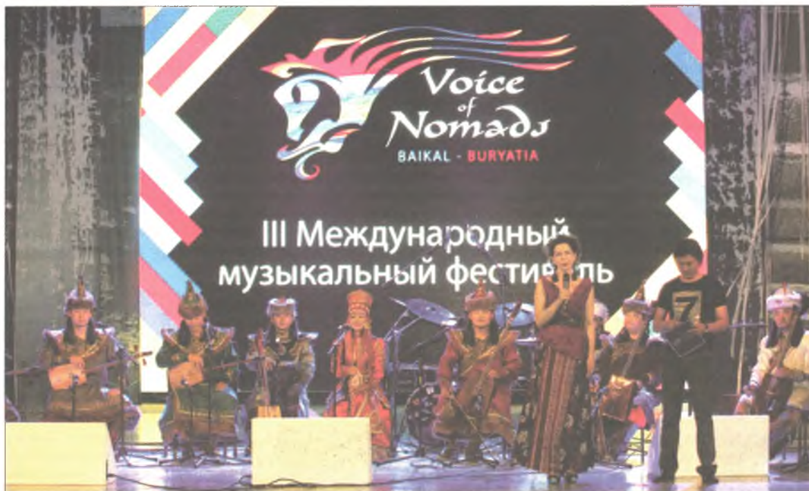
«Нүүдэлшэдэй аялга дуун» фестиваль нээлгэ

«Тывагай шэдитэ хоолой» гэжэ бүхэдэлхэйгээр суурхахан Саинхо Намчылак дуушан айлшаар буугаа. Энэ дуушан Австри гүрэндэ ажаһуудагыһе наа, түрэл тыва хэлэн дээрээ дуу дуулажа, дэлхэйдэ мэдээжэ болонхой. Түрэл арадайнгаа аялга хүгжэм дээрэ шэнэ, мүнөө үсын хүгжэмэй онол аргуудые хэ-