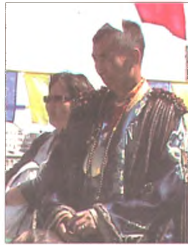
Сэргэлэн заарин бөө (МНР)