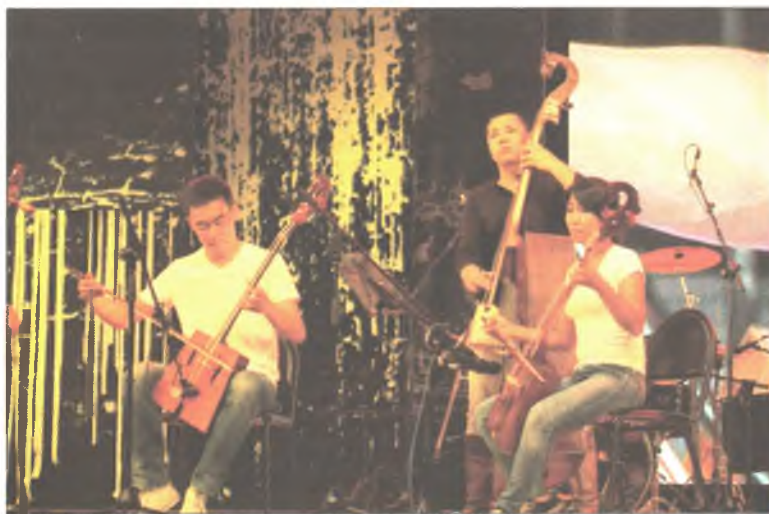
Буряадай «Хүлэг» бүлэг

- Манай бүлэгтэ 15 тоглогшод. Хүн бүхэн хатаржашье, дуу дуулажашье, хүгжэм татажашье шадхаа, - гээд Ордосой бүлэгэй хүтэлбэрилэгшэ Чулуу хөөрэнэ. -