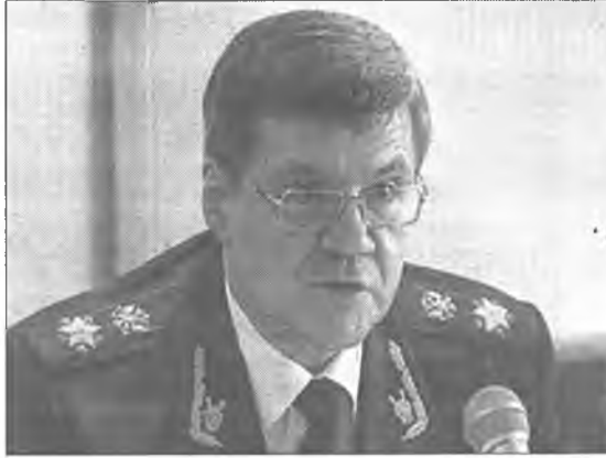
Российн Генеральна прокурор Ю.Чайка

«Гүрэнэй болон муниципальна хэрэглэмжэд эд зөөри худалдан абалга: дүй дүршэл, шийдхэгдээгүй асуудалууд, регионуудай хүгжэлтын арга боломжонууд» гэнэ асуудалаар Буряад орондо Бүхэроссин конференци хаяхан үнгэргэгдөө. Конференциин түрүүшын үдэр Сибирийн федеральна тойрогой регионуудай монополидо эсэргүү политика бэлүүлдэг управлениүүдэй хүтэлбэрлэгшэдэй зүблөөн эмхидхэгдээ. Эндэ гүйсэдхэлгын, сүүдэй болон хуули зохион гаргадаг засагай зургаануудай, тусхайлагдамал эмхинүүдэй түлөөлэгшэд хабаадаа.