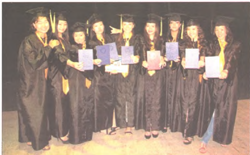
Залуу мэргэжэлтэдтэ ажал бэдэрхэдэ бэрхэтэй

«Ажалаар хангалгын агентствэдэ хандахаб. Багшын салин бага гэжэ мэдээжэ. Тиймэшые хаань, мэргэжэлээрэ ажаллаха хүсэлтэйб», - гэжэ Сэсэгма хэлэнэ.