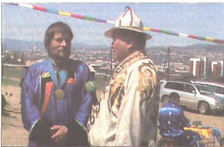
Габриэль бөө монгол сурбалжалагшатай уулзана