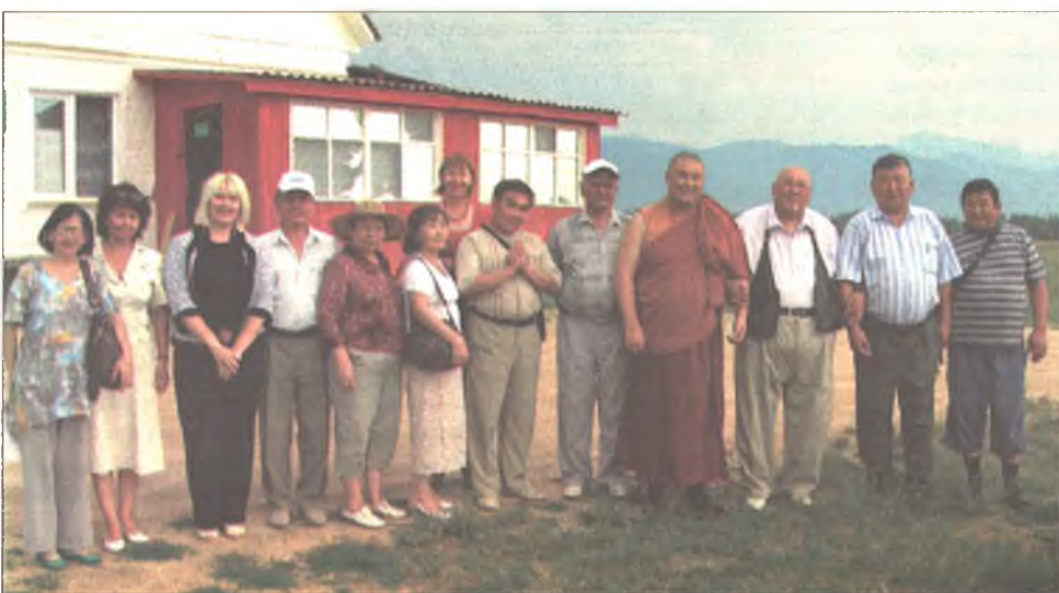
Уран зохёолшод - хүдөө нютагаар