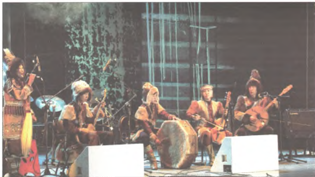
Саха Яхад Республикын түлөөлэгшэд - түрүү хуурида

рэглэжэ, онсо түхэл маягтайгаар аянга гаргана.