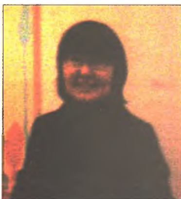
Ешин Хорло нүхэрэнь