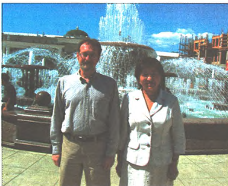
Багша ба шаби - Р.Монтгомери ба Ц.Б.Базарова

Америкын эрдэмтэнэй хэлэхээр, хари гүрэнэй эрхэтэдэй буряад хэлээр хонирхоходо, тиймэшые гайхалтай юмэн бэшэ. «Нэн түрүүн Россиин түүхэ шэнжэлхэдэ, Монгол ба Сибириин үндэһе яһатануудаар хонирхооб. Иигэжэ буряад хэлэндэ дурлааб. Англи хэлэнэй зэргэсүүлхэдэ, буряад хэлэнэй лексикэ, фонетикэ, морфологи, синтаксис юрэдөө ондоо байна, оройдоошые холбоогүй юм.