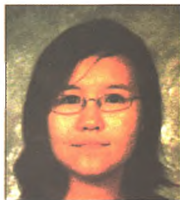
Энхэ Туяа басаганинь

Харин буряад хэлэ үзэхэдэ, орёо байбашые, үгэнүүдэинь жаса ехэ баян байна», - гээд Роберт багша ханамжална.