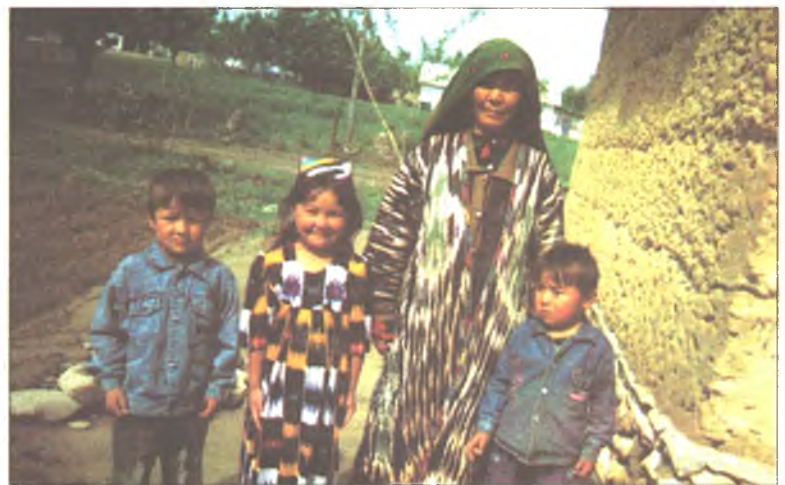
Эхэнэрнүүд, үхибүүд Таджикстандаа үлэнхэй

Ажал хэхэ дуратайшуул федеральна хууляар патентдэ хүртэхэ аргатай. Буряад Республика доторхи УФМС-эй ажалай нүүдэлэй асуудалнуудай талаар таһаг руу жэл соо 5 мянган хари гүрэнэй эрхэтэд хандаа. Иимэ документээр ажаллаха дуратай зоной дунда Узбекистанай эрхэтэд олон. Тэдэнэртэ 2740 патент үгтөө. Киргизийн 576 хүн иимэ документ хэрэглээ. 162 армянуудта тус документ үгтөө. Тэдэ булта