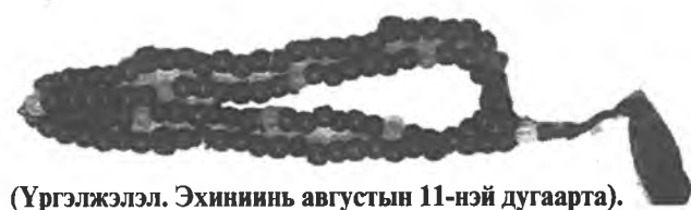
(Үргэлжэлэл. Эхинийн августын 11-нэй дугаарта).

Ехэшые хүнүүд тогооной архи нэрээд, хаа-яа ямар нэгэн шалтагаанаар архидахадаа, үетэнтээ ханажа ябаһанаа сэдхэлэйнгээ ханатар хөөрэлдөөд, намдуухан ая бараад, тарадаг хэн ха.