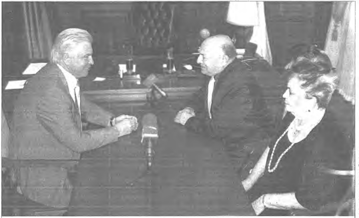
В.В.Наговицын А.П.Шапиро гэгшэтэй уулзалгын үедэ.

«Та – гайхамшагта хүн гэшэт! Би Тан тухай һайса дуулаһан байһаб, зундаа ерэхэ гэжэ дуулаад, би Тангай уулзаха гэжэ бодооб», - гэжэ Буряадай мебель хэдэг, модо болбосоруулдаг комбинадай директорээр анхан хүдэлһэн Арон Пиневиц Шапиро гэгшэтэй эдэ үдэрнүүдтэ уулзахадаа, Президент В.В.Наговицын хэлэбэ.