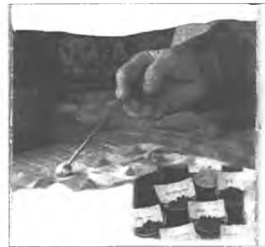
ябадаг гуримтай бэлэй. Мүнөө тэрэмнайшые болинхой.

Сагаан мүнгэн амһарта элдэб янзын хоро дарадаг гээд, мүнгэлмэл модон аяга абаад ябадаг хэн. Бүри үни урдандаа хүн бүхэн аягаа эбэртэлээд ябадаг, ондоо хүнэй аягаһаа уудаггүй - нимэ, угаа зүб заншалаа орхиһон зон гээшэбди. Миний мэдэхын, гансал ламанар өөрын аягатай