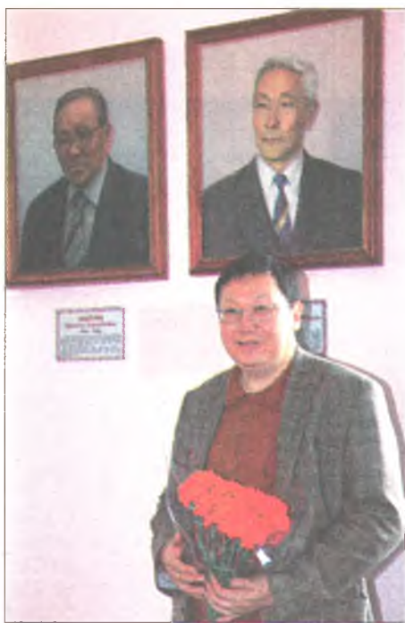
Баир хүбүүнийн дүрэ зурагайн дэргэдэ

-200 гаран эрдэмэй хүдэлмэри, олон уран хайханын литература зохион бэшэ. Бидэндэ, 916-дахи кабинеттэ дуратайгаар орожо ердэг бэлэй. Буряад литература, бэшэлгээр болохо конкурсые Д.Д.Ошоровой нэрээр нэрлэхэ