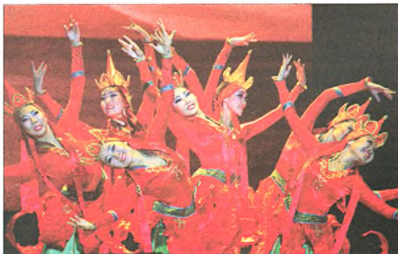
«Байгалай долгинууд» хатарна