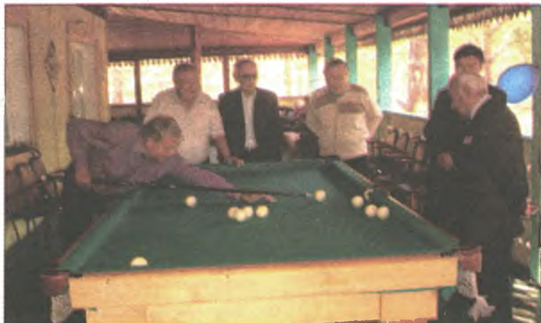
Ветеранууд бильярд наадана

байгаабди) дамжуулһандань, этигэл найдалыень харюулжа, Бүхэроссийн фестивалиин лауреадууд боложо, Москваһаа бусаһан тухайгаа дурдааб.