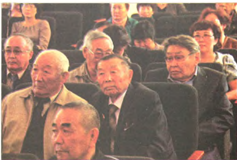
Актов зал соо

байгаа» гэжэ Хуралсалай болон эрдэмэй министерствын ахамад мэргэжэлтэ онсолһон байна.