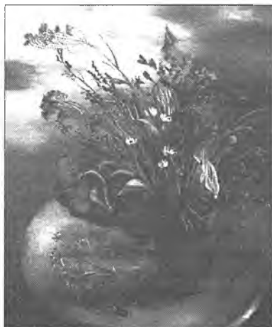
А. ЦЫБИКОВАГАЙ зураг

Талым үнгын сэсэгүүд соо Талаан, баяр, сэдхэл Хүльбэрээд, хүхээд Хухаран нэгэнииньше ганхаагүй.