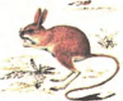
(Үргэлжлэлэнь хожом гараха).