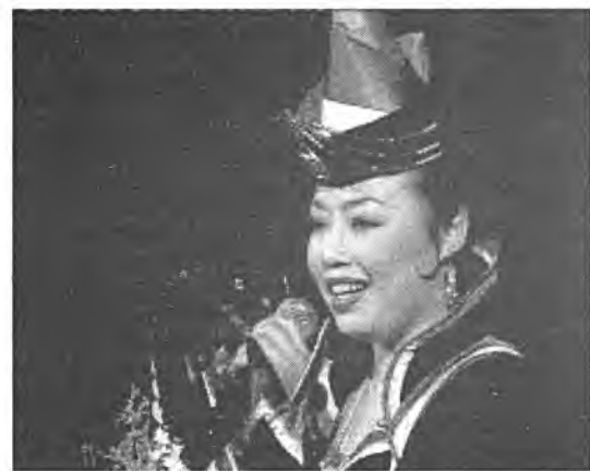
Урагшаа шармайн ябахал мэдэ. Буряад дуунай эжолоо баряад, Буурал замбяа тойрон гара. Һайхан тээһи эрид зорёод, Һанаһан орёлдоо түргэн хүрэ.

Элинсэгүүдэйш тоонто - Ага нотаг Эжэл шамаяа энхэрэн хүлээдэг. Уужам Урта баян суутай - Угайш солын урыал дуутай. Тариин нуурай номхон нуруу Таатай дууеш шагнан байхал. Дээдэ-Бооржын мүнгэн хюруу Дэлгэр сэдхэлшын хайраад абахал. Адуун Шулуун маная сараад, Алдар сольш хүлээн нуудаг. Алхана уула налай татаад, Аягыни дээжэ өгшөөн байдаг. Хада майла, тала дайда, Хүбишэ тайга, гол горход - тулгашни. Дуулаха хэшэ, энхэ байдал, Дүүрэн жсргал - далгашни. Эжы абыни буян ехэ, Эхин харгыни эсэ үды. Угайш үндэһэн угаа бүхэ -