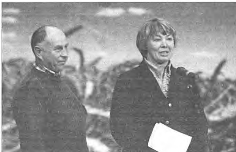
Түнхэнэй аймагай фермернүүд - Спиринтэнэй бүлэ