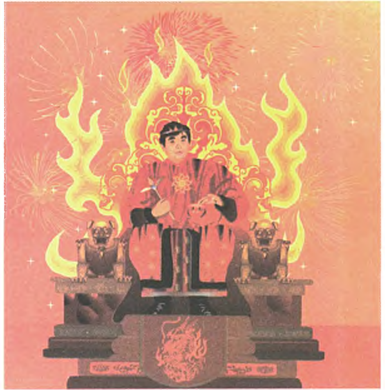
Сахяагай -нойон, Галай-хан, Гал Заяши, Гал-тэнгри, Галай-хан Мираза - много имен у Него. Он - родитель всех многочисленных и безымянных духов огня, обитающих везде, в каждом доме.