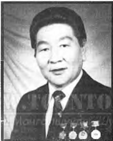
Монгол Улсын арадай артист, Россин Федерациин, Буряад Республикын арадай артист, профессор, Хуасай обогой Дэмбэрэлэй Жаргалсайхан удаан үбшэлжэ, 2011 оной ноябриин 4-дэ наһа бараба.

Д.Жаргалсайхан 1939 ондо Дорнод аймагай Дашабалбар сомондо түрөө. 1948—1954 онуудта Дашабалбар, Баян-Уул сомонудай дунда хургуулида нуража, 1956-1959 онуудта Дорнод аймагай болон Улсын хүгжэмтэ драмын театрта дуушанаар ажаллажа, уран бүтээлэй замаа эхилэн байна. 1961-1966 онуудта Болгарин Софи хотын консерваторидо нурагсажа, оперын дуушанай мэргэжэлтэй болоһон байна.