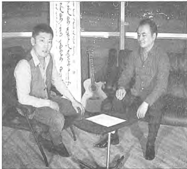
«ХҮСЭЛ» гарагай 6-да 19.05-да, гарагай 7-до 10.30 -да харагты