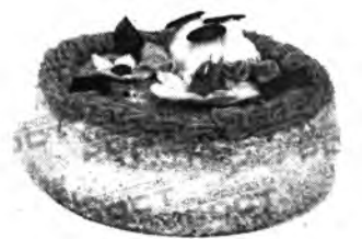
Энэ хуудаһа Бэлигма ОРБОДОЕВА бэлдэбэ.

Все смешать, добавить 3 стакана муки, раскатать тесто. Тесто намазать любым вареньем, посыпать крошкой и выпекать.