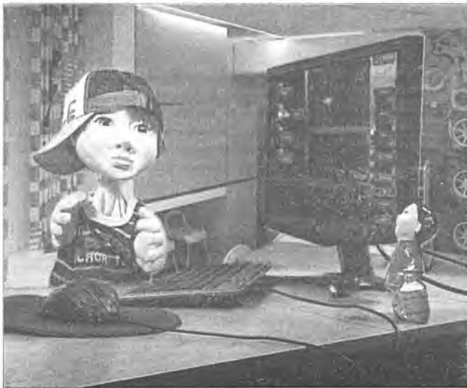
Шэнэ дамжуулгын Шэгшүүдэй