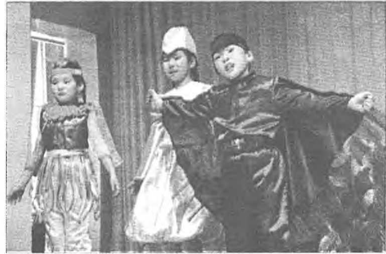
Оронгын бишыхан артистууд