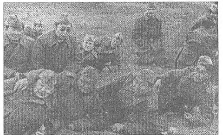
Военные сборы. Редакция армейской газеты на привале.