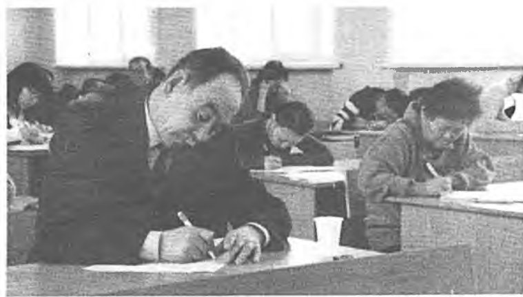
Нютаг тухайгаа бодолууды холбогшиод

Илагшадта динломууд болон үнэтэ бэлэгүүд барюулагдаа. «Буряад үнэн» сонинной 90 жэлэй ойдо зорюулагдаһан баяр ёһололой суглаанда гэхэ гү, али фестивалин түгэсхэлэй үдэр энэ конкурсо 1-дэхи хуури эзэлгшэдтэ бэлэгүүд барюулагдаха юм. Энэл үдэр Үндэһэтэнэй гуманитарна институтдай танхим соо журналист-