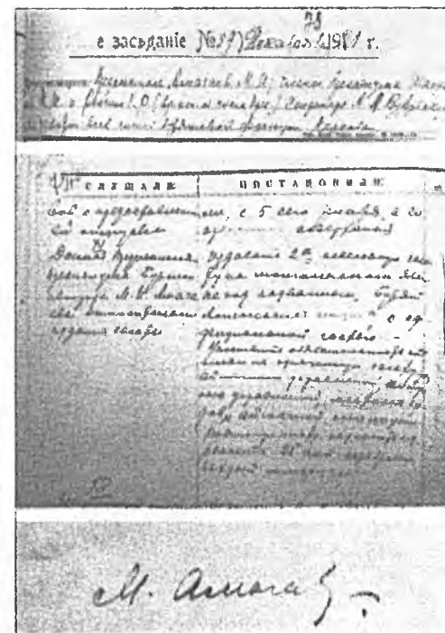
Түрэнхэ сагые гэршэлхэн түүхэтэ тогтоолнай