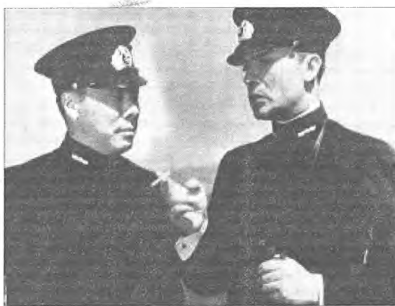
Из к/ф «Потомок Чингисхана».