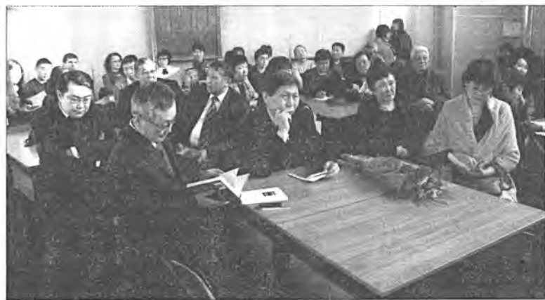
В зале не было свободных мест