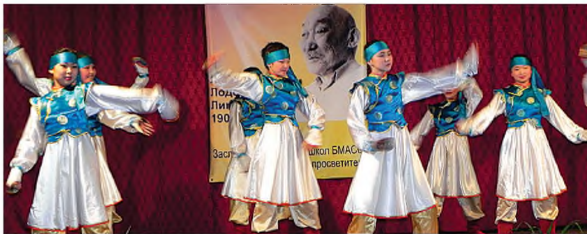
«Оронго» ансамбль хатарна