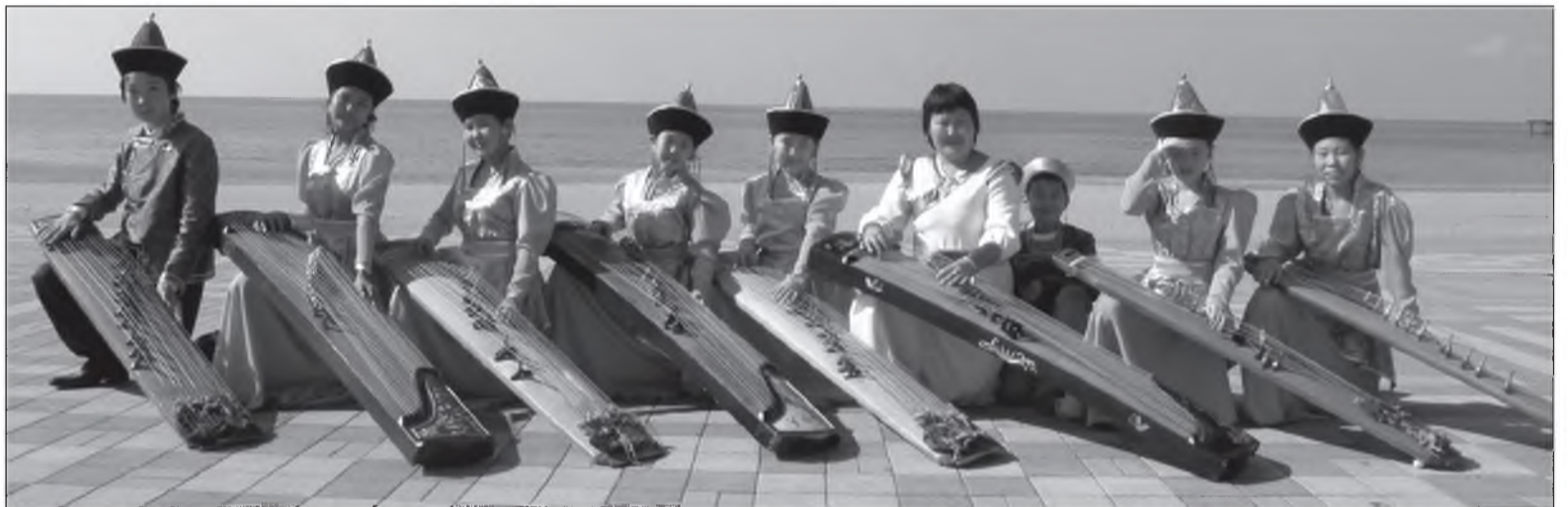
Хүгжэмшэд Туапсе хотодо