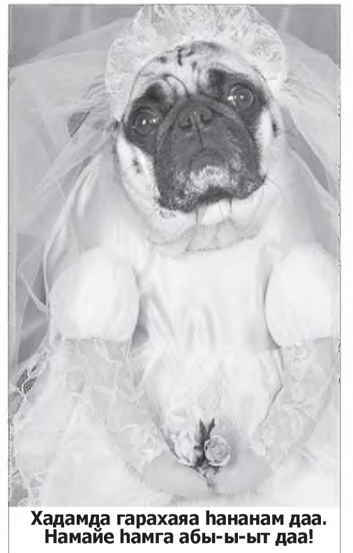
Хадамда гарахаяа һананам даа. Намайе һамга абы-ыг даа!