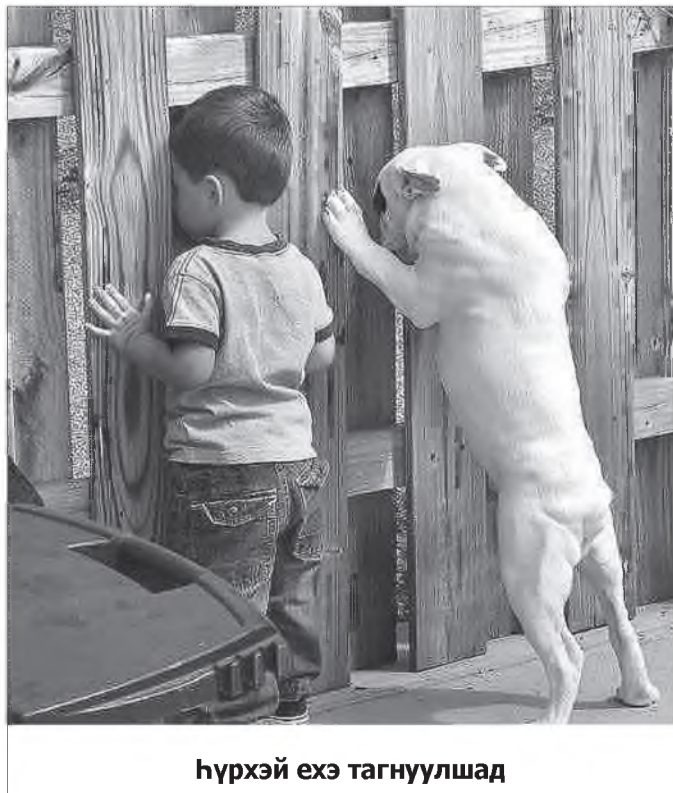
Һүрхэй ехэ тагнуулшад