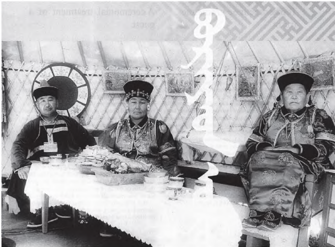
Имагтал мал ажалтай Агын буряадуудай эдээ хоолойнь зүйл мяхан, сагаан эдээн байһан юм.

МЯХАН. Ноябрьриин һүүлээр, декабрь соо айл бүхэндэ үүсэ хэлгэн болодог хэн. Тон үгэнтэй хүн нэгэ бодо, арбаад гаран бодотой болоод ерэхэлээрээ хоёр бодо, хорёод бодотой айлууд гурбан бодо аладаг байгаа. Энэ мяханинь, тухайлхада, май нара шахатар хүрэдэг хэн. Шадалтай баян зон мяхаяа бүхэлээр шанажа эдидэг, дунда ба доодо шадалтан ехэнхидээ мяхаяа жэжэхэнээр хэршээд, шүлэ гаргадаг байгаа. Зүгөөр бүлынгөө түрүү эрэшүүлдэ шүлэнһөө гадна бүхэли мяха шаналсажа үгэдэг хэн. Шүлэндөө холихо юмэниинь гэхэдэ, гансал орооһон байгаа. Ехэ тогоон соо орооһоёо хээд, яһатай мяха үйжэ, орооһонойнгоо үлтиртэр бусалгахадань, ехэ үдхэн шүлэн болодог юм. Тэрэнээ уужа садаад, үлэнэн орооһоёо үглөөдэрэйнгөө шүлэндэ хэжээ хадагалдаг хэн.