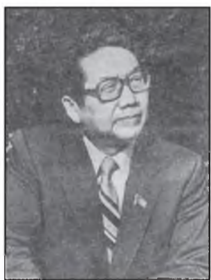
(Ургэлжлэл. Эхининь январин 19-эй, 26-ай дугаарнуудта).

Гурбан дабхар үрсэн тэндэнь бодобо. Гунаг сарай арһаар татуулһан үүдэн — Нэгэдэхи, эхин үрсэн болобо. Хоёрдохинь - нюдэнэй хёрхые дуудан, Холоһоо арайл харагдажа ялалзааша Гуудин шара горьё байба. Саашаа, Гурбадахинь - аржагар улаан шэнэнһэн, Гурбан үрсэн гэдэгынь одоо энэ һэн.