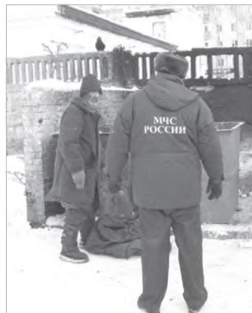
МЧС-эй мэргэжэлтэд рейд хэлэ