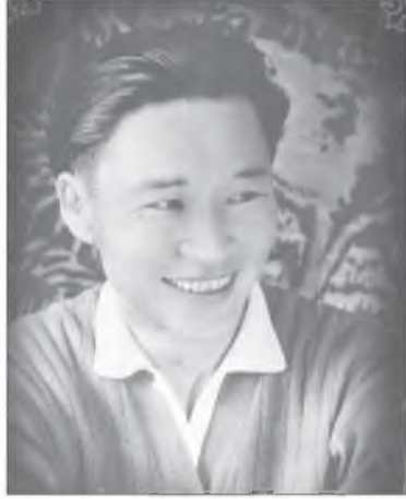
Гомбо Гылыкович залуудаа