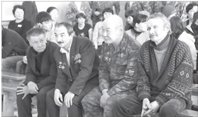
Афган дайнай сэргэгд

1989 оной февралин 15-да хүүлшын совет сэргэшэ Афганистанай газарһаа гараһан ушарай хүүлээр 23 жэл үнгэрбэ. Энээндэ зорюулагдаһан хэдэн хэмжээ ябуулга Улаан-Үдэдэ эмхидхэгдээ.