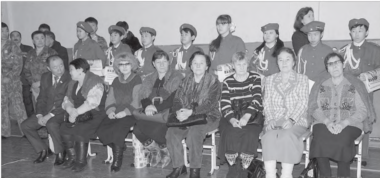
Баатар сэргэгдэй дурасхаал мүнхэ

1989 оной февралин 15-да хүүлшын совет сэргэшэ Афганистанай газарһаа гараһан ушарай хүүлээр 23 жэл үнгэрбэ. Энээндэ зорюулагдаһан хэдэн хэмжээ ябуулга Улаан-Үдэдэ эмхидхэгдээ.