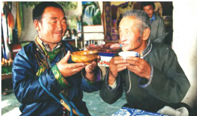
Бууралһаа үгэ дуулажа...

Үнгэрһэн сезонойнгоо түгэсхэлдэ Буряадай гүрэнэй филармониин артистнууд “Баруун буряадуудай дуунуудай” солгёон, ордоһотой концертээр дүүргээ бэлэй. Харин һаяхан Сагаан харын хүндэлдэдэ “Сто песен восточных бурят” гэнэн урданай дуунуудай дискин концерт-презентаци хоёр үдэшин туршада филармониин “Урагшаа” хүгжэмтэ театр-студиин дуушад, хатаршад дурадхажа, залаар дүүрэн зонийе суглуулба, зүрхэ сэдхэлымнай бая-