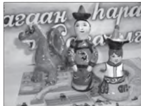
Араһаа һалгаангүй үмдэжэ, Бэээ шэмэхэтнай болтогой!

Залаатайхан малгайгаа, Туруутайхан дэгэлээ, Эрмэгтэйхэн гуталаа, Уужатайхан тэрлигээ