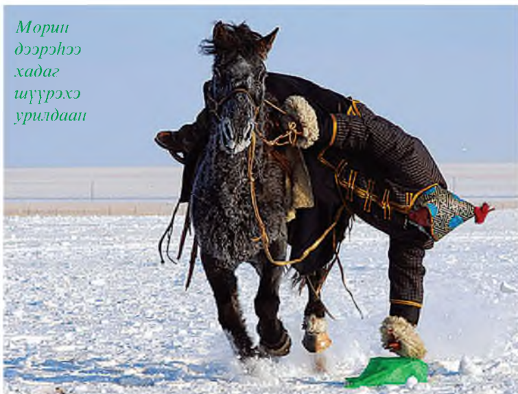
Морин дээрхээ хадаг шүүрэхэ урилдаан

2012 оны сар шинийн Өвөр Монголын Шинэ Барга зүүн хошууны мөнгөн өвлийн наадам.