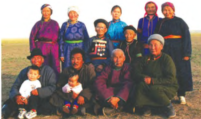
Буян хэйшгэтэй буряад араднай