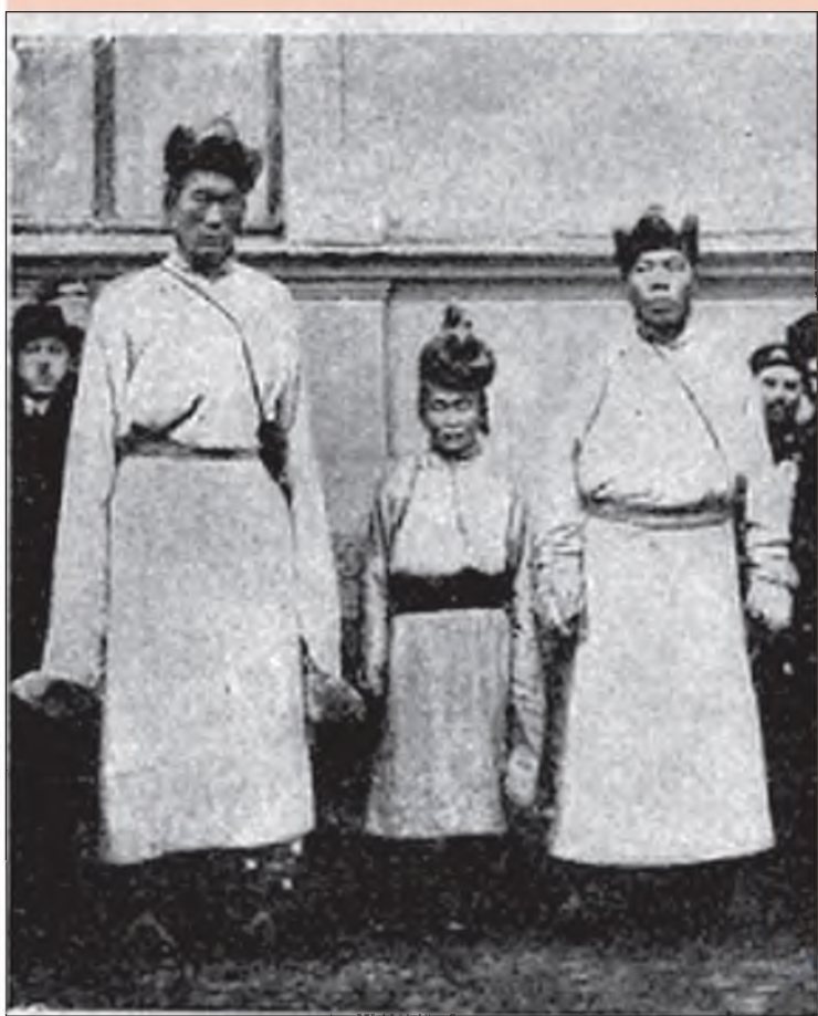
Монгольских солдат с успехом могли бы показывать за деньги. Рост их необычен: одного – 3 ари.10 вер., другого - 3 ари. 7 вер.

К пребыванию в ПЕТЕРБУРГЕ чрезвычайной монгольской миссии.