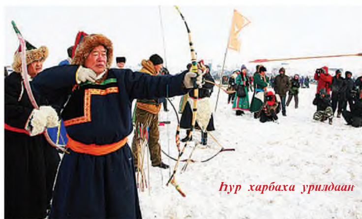
Нур харбаха урилдаан