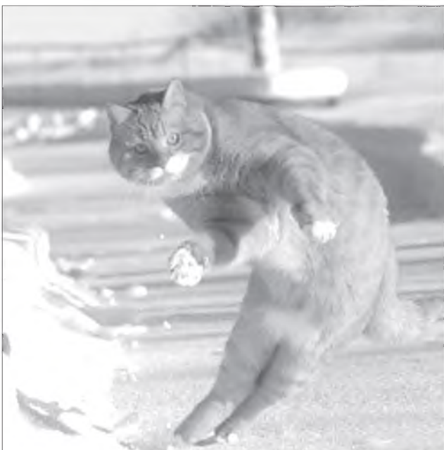
Стяганууд булта буги-вуги хатардаг