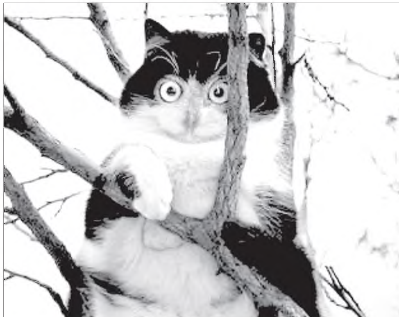
Би - шара шубуулиби