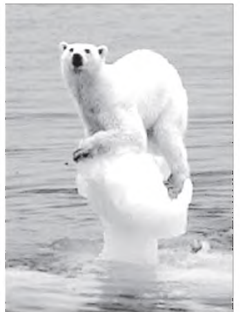
«Глобальна» халуун эхилбэ гү?