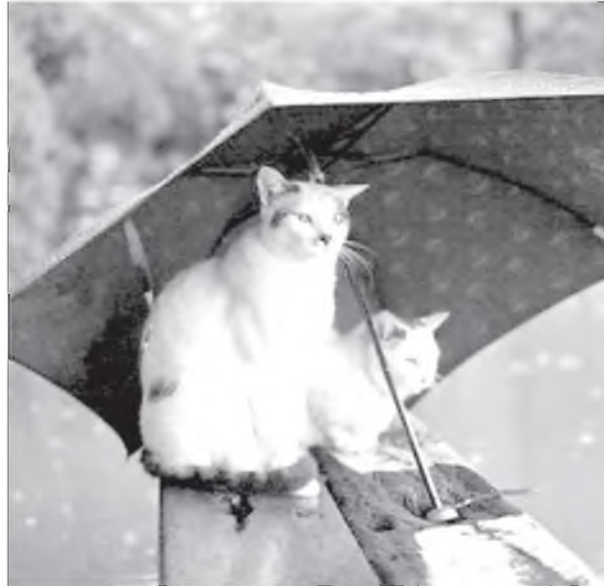
Юумэнэй бүтэхэдэ, байгаалар һайхашааха болохои