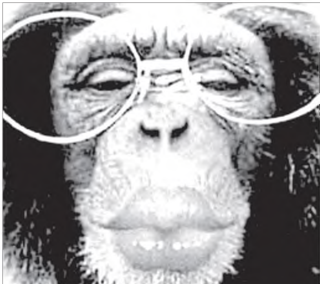
Би гоёб даа...!