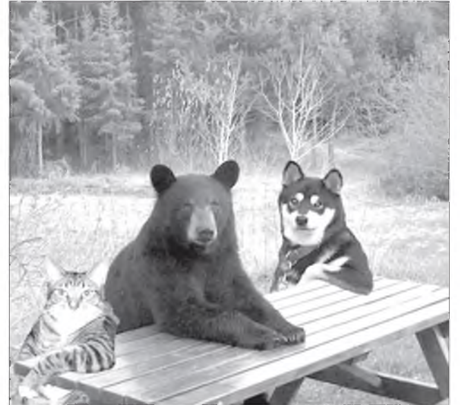
Гоё даа...! Юунэйшые түлөө ханаагаа зобхогуйиш