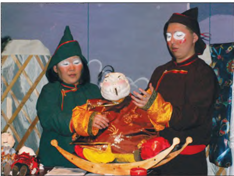
"Тархайн хүбүүн Зархай" гэнэн зүжэгһөө хэнэг