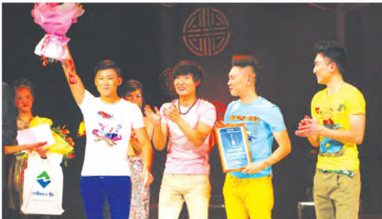
«Уран» эстрадна бүлэг

Эльвира ДАМБАЕВА, манай корр.