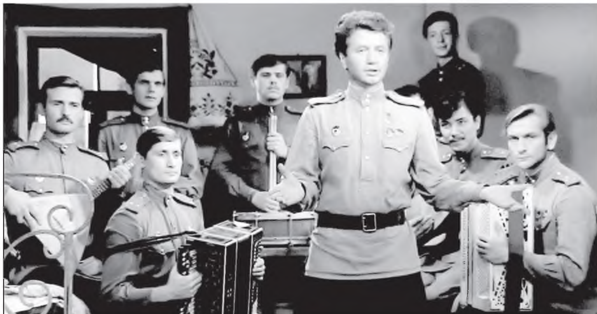
Дашарабдан, Цырегма Гомбодоржиевтанай оршуулга (дубляж) хэһэн «В бой идут одни старики» фильмһээ хэһэгүүд