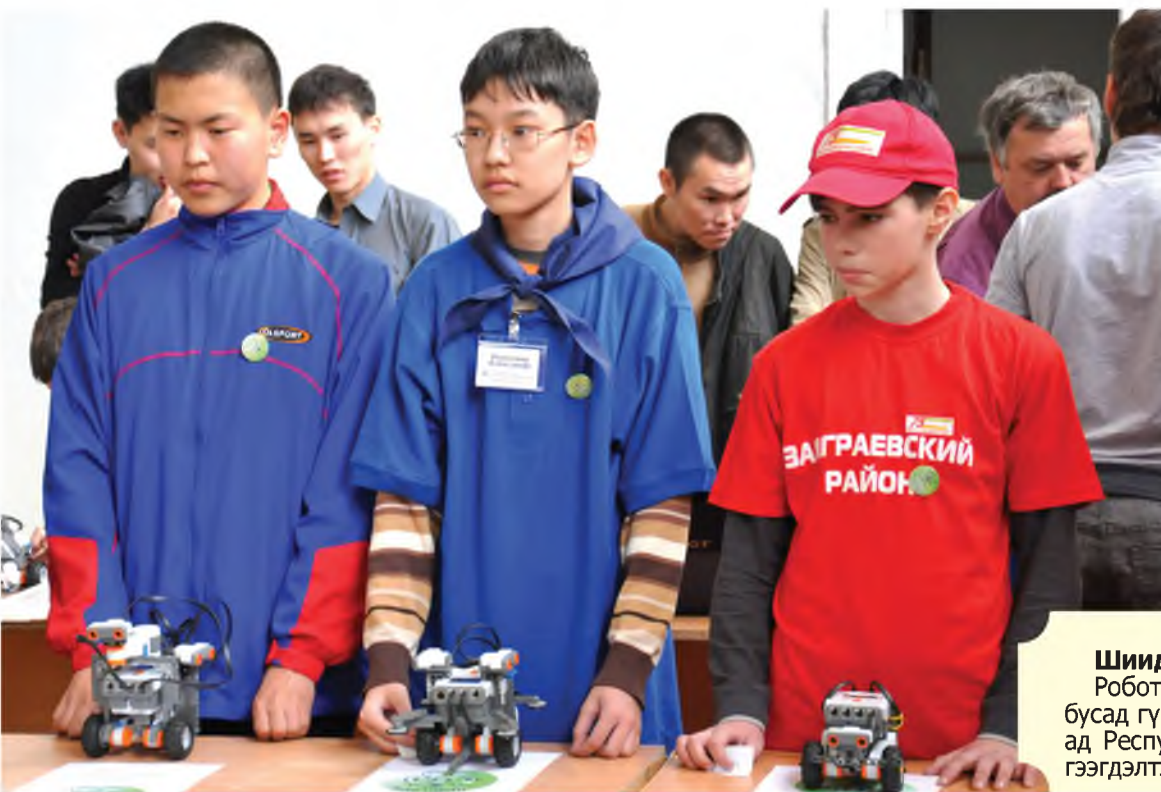
Хүбүүд түрүүшынхией конкурсно хабаадаба

Мүнөөдэр республика дотор 20 эмхинүүдтэ хүүгэд конструкторнууд дээрэ хүдэлнэд. Эрдэмэй Бага Академи тус эмхинүүдтэ 4 конструктор дамжуулаа. Хүүгэдэй нэмэлтэ нуралсалай Республиканска түб үшөө 6 конструктор худалдажа абаһан байна. Тиймэһээ ерээдүйн эдир