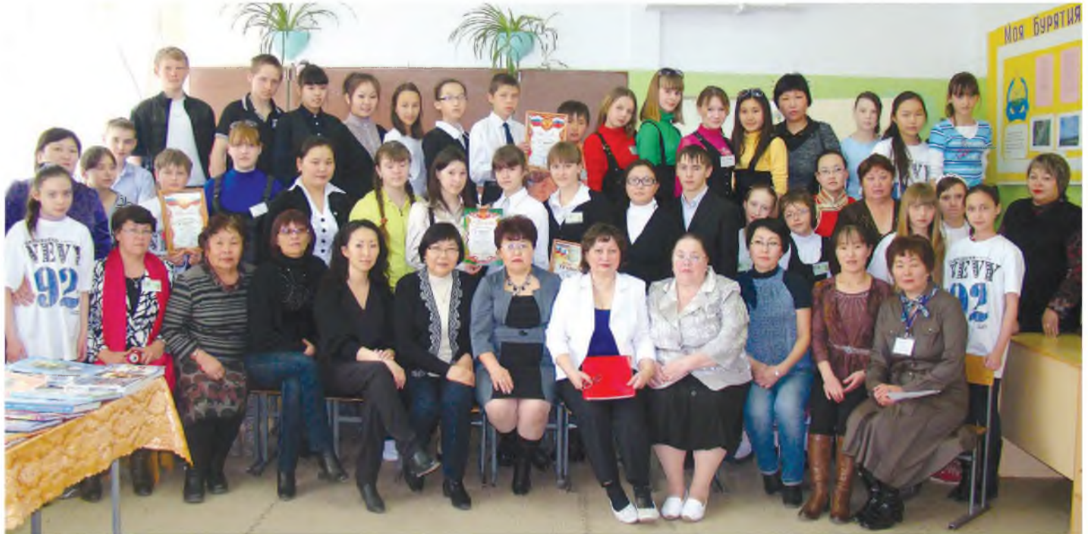
Сэлэнгын аймагай эдир сурбалжалагшадтай «Мүнгэн гуурһан» гэхэн слёдой үедэ

Буряадта бүхэ аймагуудта 2000 онһоо хойшо хургуулин сонинууд байгуулагдаа юм. Мүнөө тэдэнэй тоо 80-һаа 230 болотор урганхай. Республикын хүүгэдэй хэблэл хургуулин радио болон телегазетнүүдэй мүндэлэлгэдэ түлхисэ боложо үгөө. Тэрэшэлэн хургуулин хэблэлэй түбүүд, сайтнууд болон медиахолдингнууд эмхидхэгдэнэ, хүүгэдэй ниитын эмхинүүдэй болон эдир сэтгүүлшэдэй эблэлнүүдэй хоорондохи харилсаан эдэбхижүүлэгдэнэ.