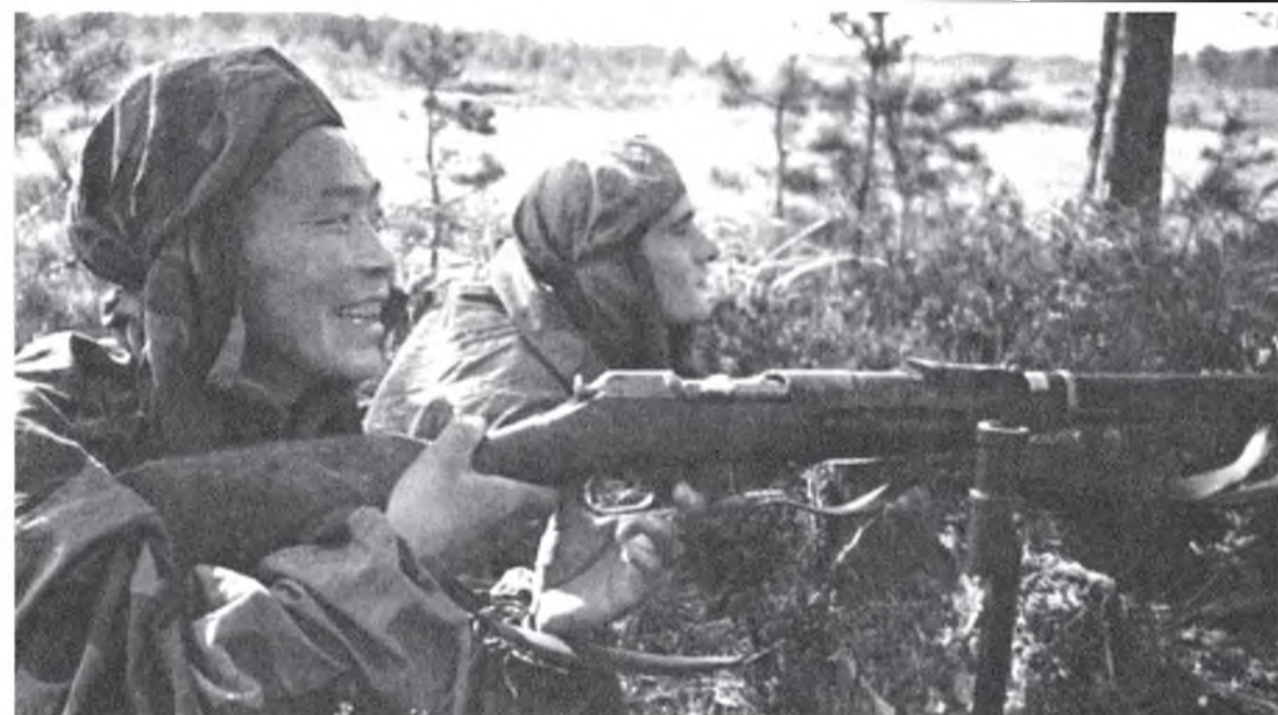
С рхим снайпернууд С.Номоконов болон Б.Канотов. 1942 он.

Х энэйшье мэдэхээр, буряад ангуушад амитанай арһа бүтэн үлээхын тулада нюдэ руунь оножо буудадаг һэн. Тиигэжэ тэдэ мэргээр буудалгын аргагүй ехэ дүй дүршэлтэй байгаа бшуу.