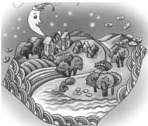
Баабайн мунгые тооложо ядааб. Эжын торгон хүнжэлые эбхэжэ баран ядаабди.