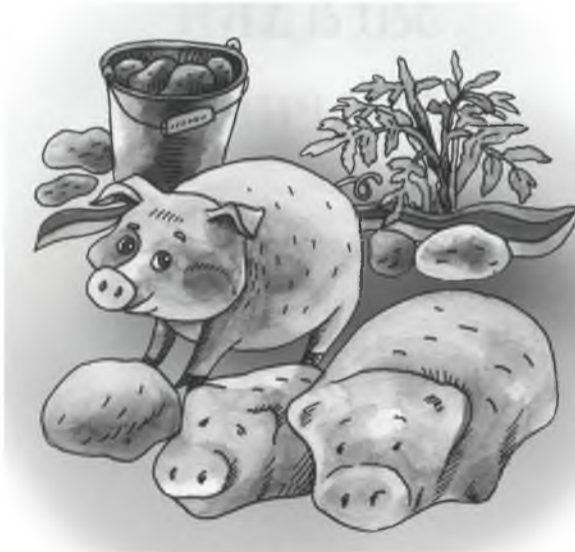
Газар доро гахай түрээбэ