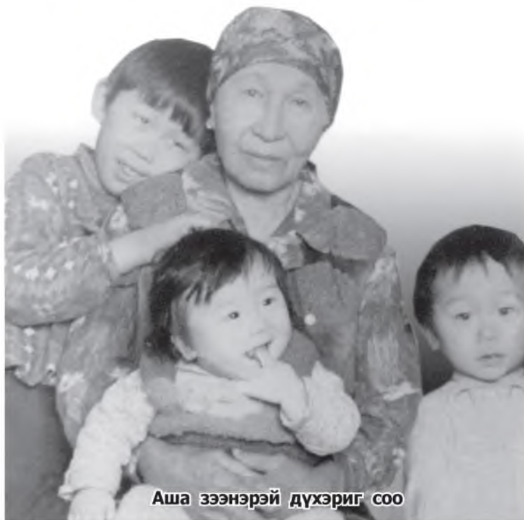
Аша зээнэрэй дүхэриг соо

ша хэм, шархатаһан, контузи абаһан тухайн, бэшэшье шагналнууд тухай сэрэгын билет соонь бэшэгдээгүй хэн. Урдань лама байһан хадаа шагналнуудта хүртөөгүй юм гү, тэрэниие би мүнөө гайхагшам.