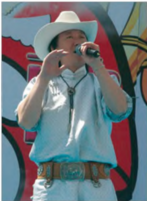
"МИНИИ АБА УЛААН-БААТАРТА БАЙНА"