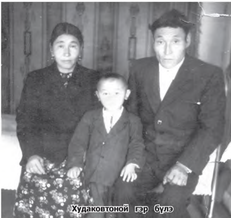
Худаковтоной гэр бүлэ